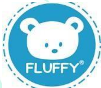
Gambar 2.1 Logo Fluffy Baby