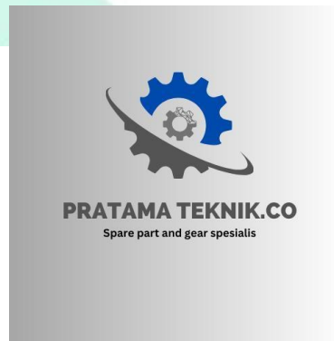
Gambar 2.1 Logo CV. Pratama Teknik

Awal mula Perusahaan Pratama Pada tanggal 10 Januari 2021, Perusahaan Pratama Teknik didirikan oleh Bapak Satiyo, dengan fokus pada bidang konstruksi alat berat. Pada awalnya, pemasaran produk perusahaan ini dilakukan melalui jaringan rekanan saja. Namun, seiring dengan perkembangan dunia digital, Pratama Teknik melakukan berbagai penyesuaian agar dapat bersaing di era digitalisasi ini.