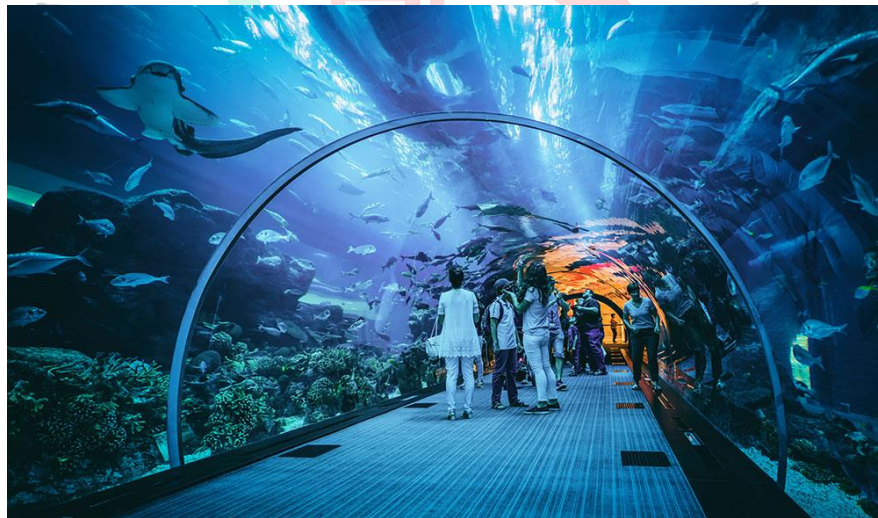
Gambar 2. 2 Oceanarium BXSea

Property merancang daerah tersebut untuk memenuhi kebutuhan kelas menengah yang berupa perumahan dan fasilitas publik. Graha Raya termasuk ke dalam portofolio penting perusahaan dengan perkembangan yang pesat dan akses mudah ke berbagai daerah strategis serta fasilitas publik. Tidak jauh dari Graha Raya, terdapat daerah pengembangan PT Jaya Real Property yaitu Serpong Jaya. Daerah pengembangan di Serpong Jaya juga mengedepankan hunian berupa rumah tapak hingga apartemen yang berkembang pesat dengan pengembangan yang dilakukan oleh PT Jaya Real Property di Tangerang Selatan. Lalu, PT Jaya Real Property juga aktif meningkatkan portofolio perusahaan dengan membuat kawasan komersial dan pusat perbelanjaan seperti CBD Emerald yang menjadi pusat komersial dan bisnis dan Bintaro Jaya Exchange sebagai pusat perbelanjaan lengkap yang terus di kembangkan secara pesat dengan adanya mal, hotel sampai pusat hiburan wahana Oceanarium megah yang dinamakan BXSea sebagai bentuk pusat hiburan keluarga.