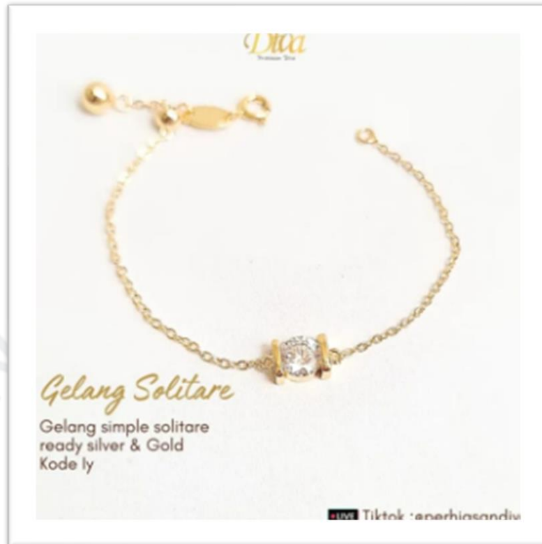
Gambar 2.8 Produk Perhiasan Diva