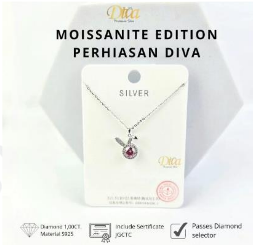
Gambar 2.4 Produk Perhiasan Diva