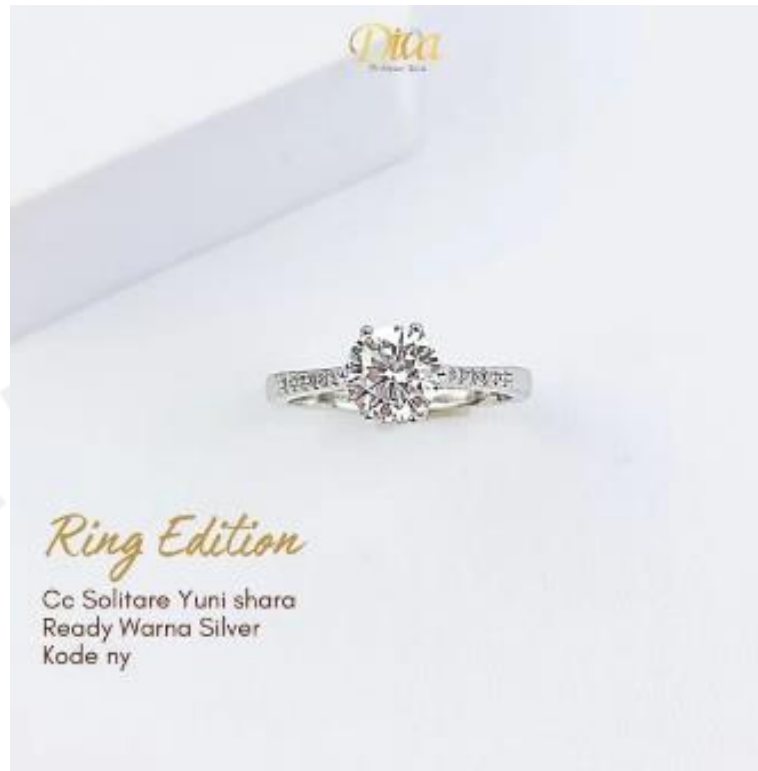
Gambar 2.6 Produk Perhiasan Diva