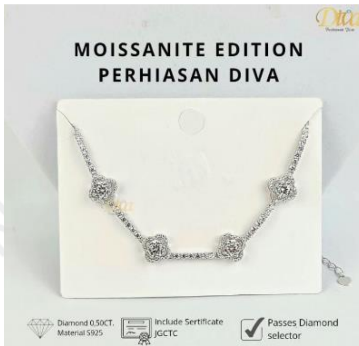
Gambar 2.5 Produk Perhiasan Diva