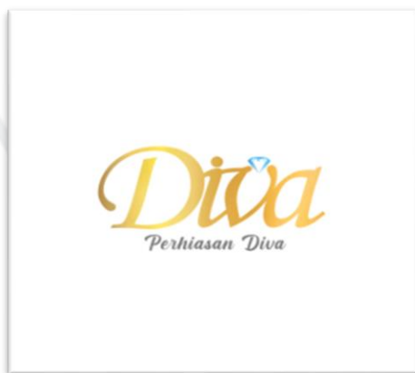
Gambar 2.1 Logo Perhiasan Diva