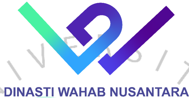
Gambar 2. 1 Logo PT Dinasti Wahab Nusantara