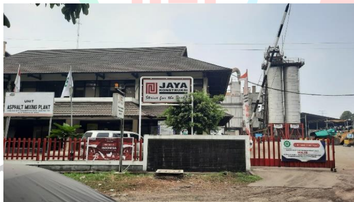
Gambar 1. 1 AMP PT. Jaya Konstruksi Manggala Pratama, Tbk

Kerja Profesi dilaksanakan di AMP PT. Jaya Konstruksi Manggala Pratama, Tbk, yang berlokasi di Kawasan Industri Pulogadung Blok 3.T.10 No.3, Jl. Rawa Bulak II No. 1, RW.9, Jatinegara, Kec. Cakung, Kota Jakarta Timur, Daerah Khusus Ibukota Jakarta. Praktikan menjalankan kegiatan kerja profesi di Kantor Kontraktor Utama AMP PT. Jaya Konstruksi Manggala Pratama, Tbk Proyek Pembangunan atau peningkatan jalan-jalan strategis di Provinsi DKI Jakarta (Pekerjaan Jalan Hotmix Rasuna Said Tahun 2023).