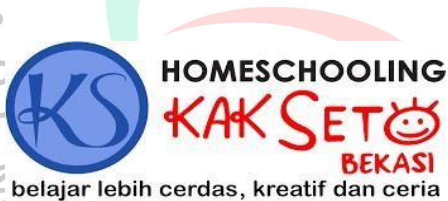
Gambar 2.2 Logo Yayasan