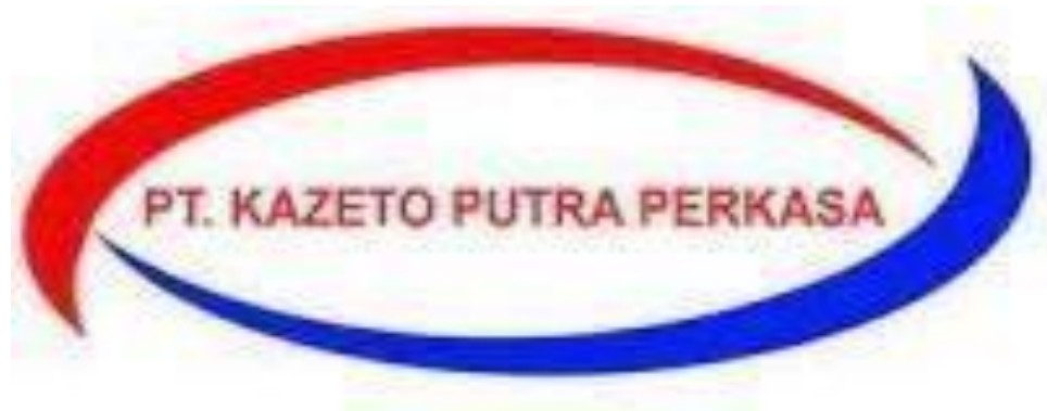
Gambar 2.1 Logo Perusahaan