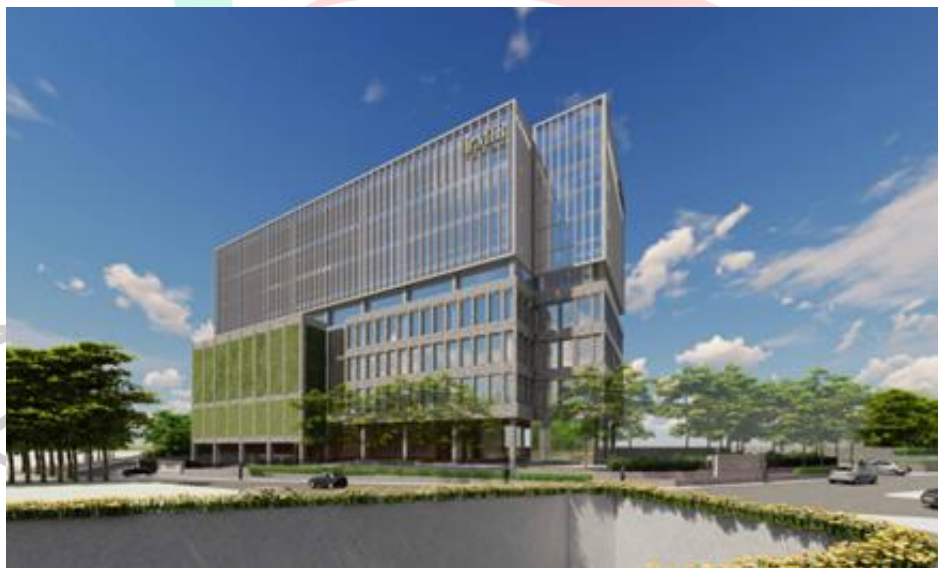
Gambar 1. 4 Desain kantor MIR