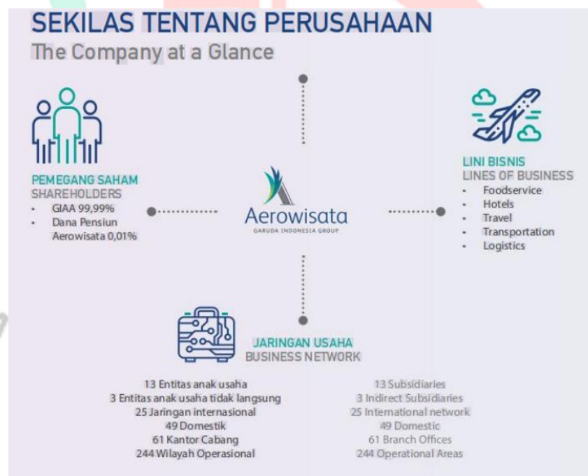
Gambar 2. 3 Kegiatan Umum Aerowisata

PT. Aerowisata memiliki berbagai kegiatan utama yang mencakup pengelolaan bisnis di bidang pariwisata, perhotelan, makanan dan minuman, transportasi, serta jasa pendukung lainnya. Sebagai anak perusahaan dari Garuda Indonesia Group, Aerowisata berfokus pada penyediaan layanan terpadu untuk memenuhi kebutuhan wisatawan, termasuk pengelolaan hotel, layanan katering pesawat, dan transportasi darat.