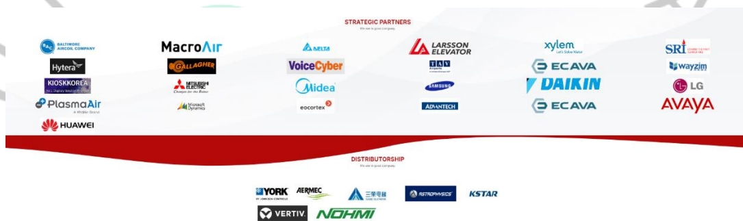
Gambar 2.2 Partner dan distributorship PT. Jaya Teknik Indonesia

Seiring berjalannya waktu, PT. Jaya Teknik Indonesia terus memperluas portofolionya dengan mulai menjalin hubungan dengan beberapa perusahaan besar seperti Gallagher dan Microsoft Dynamics , hingga mampu menjadikan produknya sebagai distributor resmi merek ternama, termasuk Siemens , Teledyne , dan ICM . Dengan adanya langkah memperluas ini menandakan adanya dedikasi perusahaan untuk bisa menjangkau kapabilitas teknisnya hingga menawarkan solusi inovatif kepada klien.