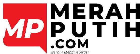
Gambar 2. 1 Logo PT.Merah Putih Media

Desain logo yang dimiliki PT. Merah Putih Media terinspirasi dari bendera