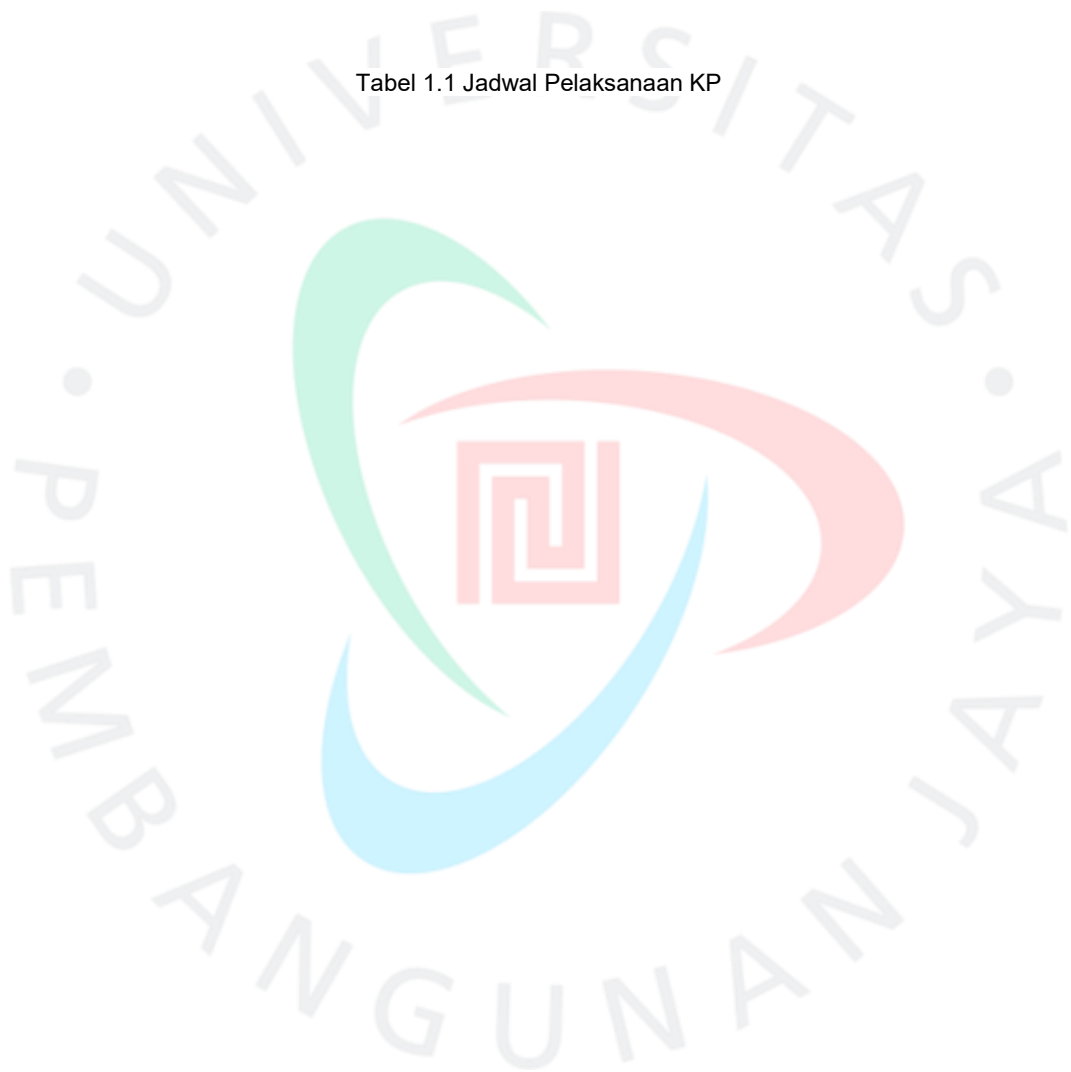
Tabel 1.1 Jadwal Pelaksanaan KP