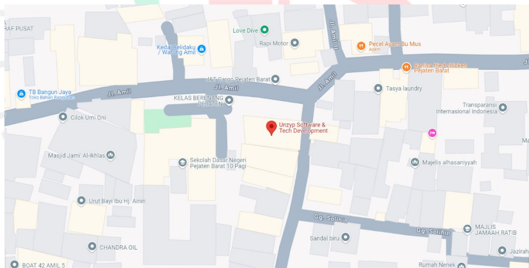
Gambar 1.1 Peta Lokasi Perusahaan

Tempat terlaksananya kegiatan Kerja Profesi dilampirkan dalam bentuk tabel yang berisikan data perusahaan yang ditempati oleh praktikan. PT. Unzyp Solusi Teknologi berlokasi di Jl. Amil No.60, RT.2/RW.4, Pejaten Barat, Pasar Minggu, Kota Jakarta Selatan, Daerah Khusus Ibukota Jakarta kode pos 12510.