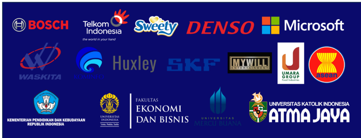
Gambar 2.4 Klien Unzyp Software

Produk hasil yang dikerjakan sudah banyak dipakai oleh perusahaan besar baik BUMN dan BUMS, serta instansi pendidikan. Produk yang dihasilkan dengan contoh dari PT. Waskita Karya yang meminta untuk merancang dan mengembangkan situs resmi mereka yang sudah dapat digunakan oleh masyarakat umum.