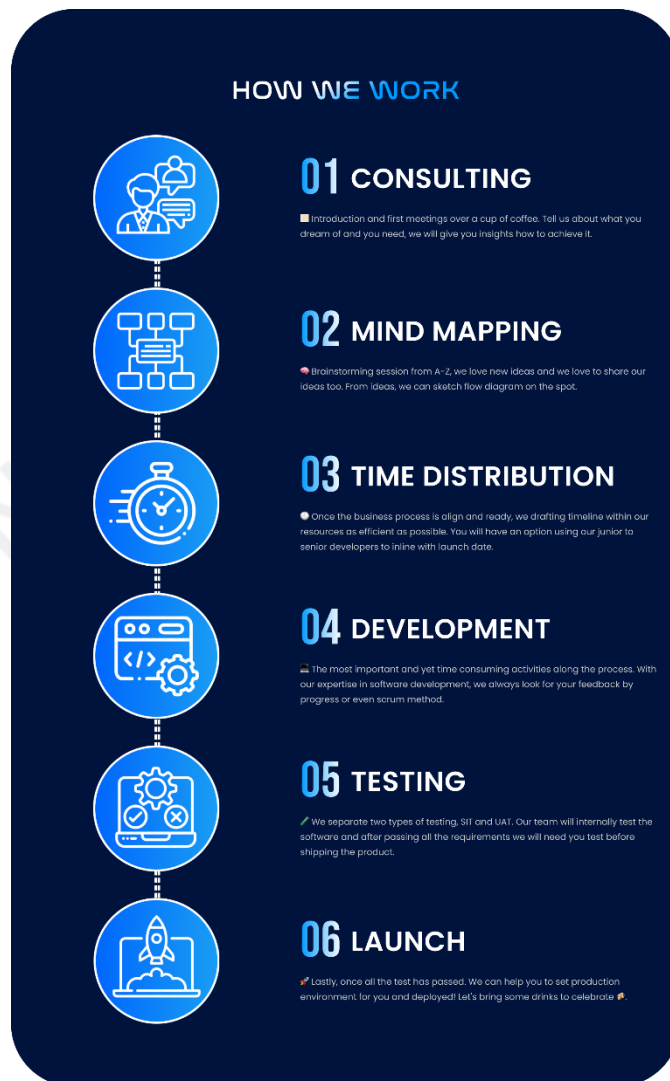
Gambar 2.3 Alur Skema Pengembangan Produk

Pada awalnya para klien melakukan konsultasi terlebih dahulu untuk menyampaikan permasalahan yang ingin dikembangkan. Setelah dilakukannya konsultasi, para tim dari Unzyp Software membuat mind mapping (pemetaan pemikiran) untuk menemukan jawaban dari permasalahan klien dengan tambahan masukkan dari tim yang terlibat. Selanjutnya memasuki tahapan pengembangan dan percobaan pada prototipe, setelah itu produk klien siap digunakan.