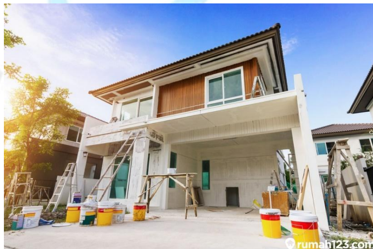
Gambar 2.4.5 Pinjaman Renovasi Rumah

Wujudkan Impian Anda Membeli Rumah. Pinjaman sederhana dan aman yang ditujukan untuk mendukung Anda selama Anda melakukan perbaikan pada rumah Anda.