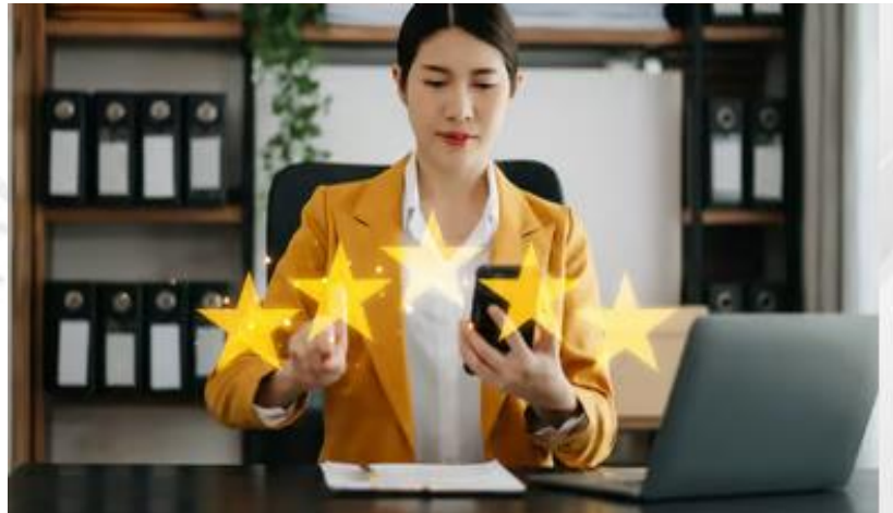
Gambar 2.4.5 Pinjaman Gold Client

Opsi Keuangan Khusus untuk Peserta anggota kelompok Terhormat. Dengan pinjaman ini, Anda dapat memanfaatkan opsi keuangan eksklusif yang mencakup peningkatan batas kredit, layanan prioritas, dan suku bunga yang menguntungkan.