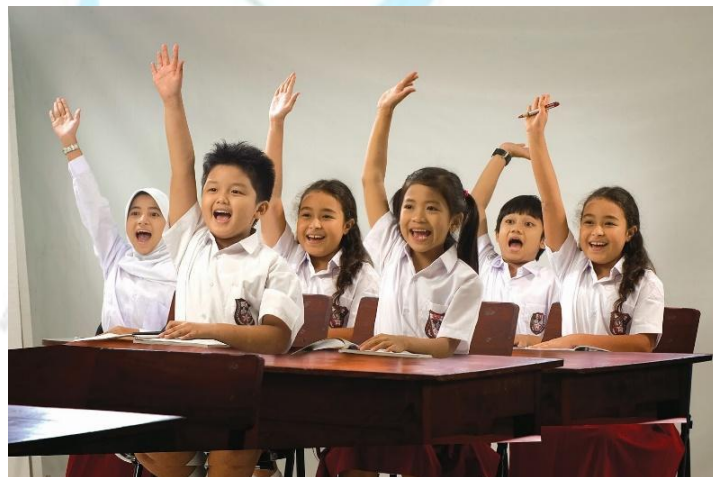
Gambar 2.4.2 Pinjaman Pendidikan

Menyumbangkan Uang untuk Pendidikan demi Masa Depan yang Lebih Cerah, program pembiayaan yang dirancang untuk mendukung anggota kami dalam memenuhi aspirasi mereka untuk menjadi pendidik.