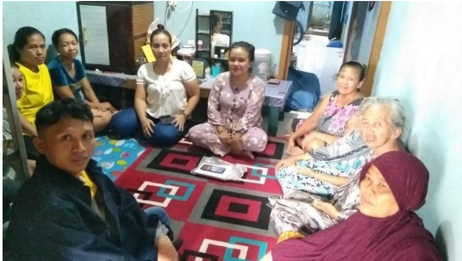
Gambar 2.4.1 Pinjam Kelompok

Harmoni dalam Pertumbuhan Perusahaan Anda. program pembiayaan yang memberikan peluang kepada organisasi bisnis untuk mendapatkan dana yang mereka inginkan guna mengembangkan bisnis, memasuki pasar baru, atau meluncurkan pinjaman ini.