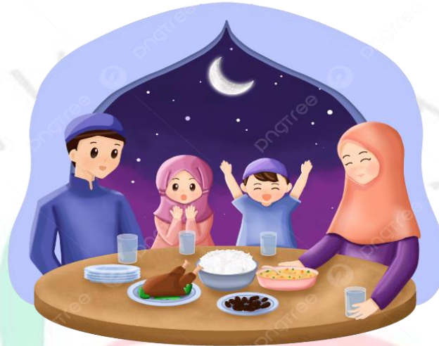
Gambar 2.4.3 Pinjaman ramadhan

Membantu dengan memberikan berkah dan persiapan selama bulan suci. pinjaman yang ditujukan untuk memberikan dukungan keuangan tambahan untuk berbagai kebutuhan, mulai dari tuntutan khusus selama bulan suci seperti berbuka puasa dan menyiapkan makanan sahur—hingga kebutuhan lainnya.