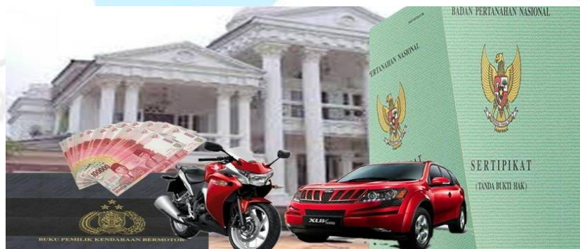
Gambar 2.4.4 Pinjaman Modal Usaha Perorangan

Percepat Pertumbuhan usaha Anda untuk Meraih Kesuksesan. Kami menyediakan opsi pinjaman dengan suku bunga terjangkau, proses pengajuan cepat, dan administrasi pinjaman fleksibel karena kami menyadari bahwa modal merupakan komponen penting dalam mengembangkan bisnis.