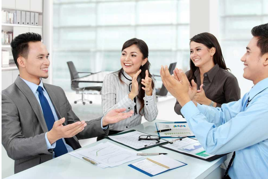
Gambar 2.4.7 Pinjaman Karyawan

Program pinjaman yang dibuat khusus untuk membantu karyawan yang berkomitmen secara finansial. Solusi Finansial Khusus untuk Pertumbuhan dan Kesejahteraan karyawan.