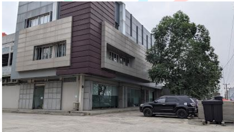
Gambar 1. 1 Gedung PT. Aliet Sakatha Rahayu

Praktikkan melaksanakan Kerja Profesi di PT. Aliet Sakatha Rahayu, yang merupakan perusahaan distributor bahan bangunan yang memasarkan bahan-