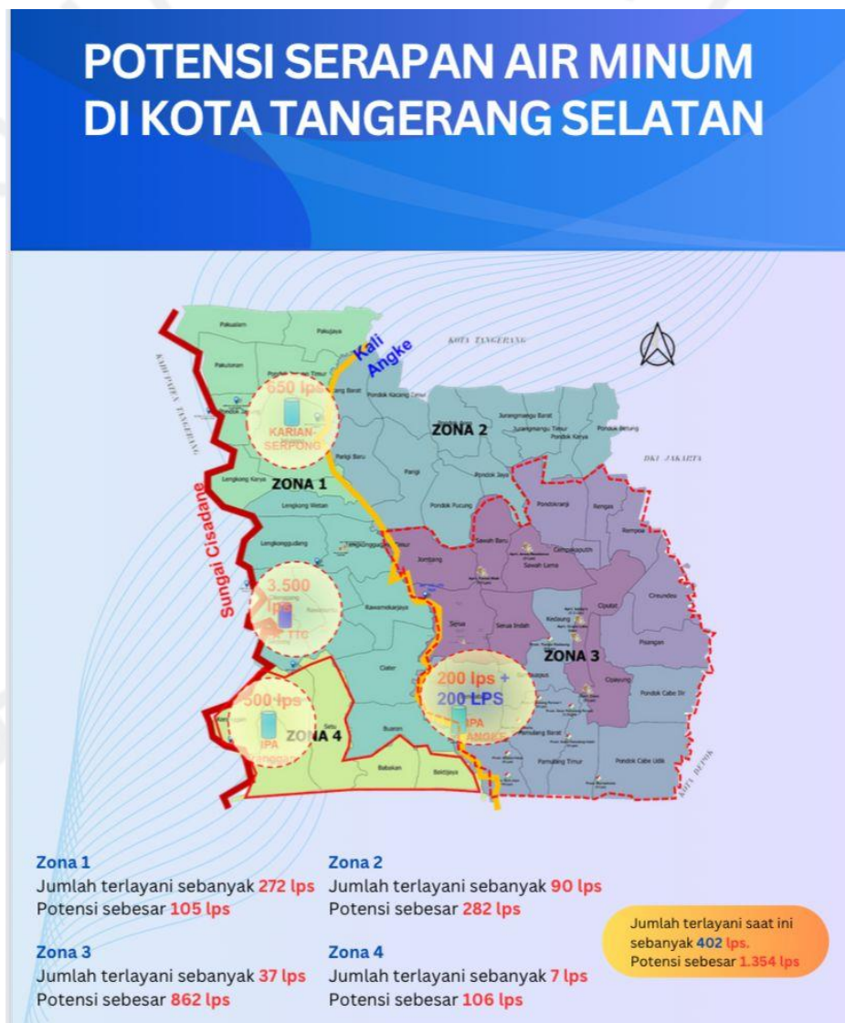
Gambar 2.4 Potensi Serapan Air Minum di Kota Tangerang Selatan (Sumber: Data Internal Perusahaan, 2023).

Perseroda PITS menyediakan layanan air minum yang langsung diolah mandiri yaitu AMDK (Air Minum Dalam Kemasan) yang bernama PITS 8.5+ yang merupakan salah satu produk divisi PAM yang sudah terdaftar di Kementerian Kesehatan Republik Indonesia.