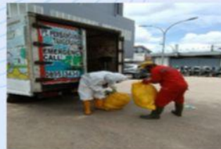
Transporter Limbah Medis & Laundry Infeksius