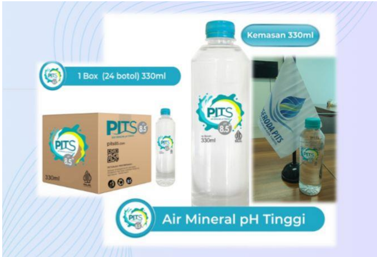
Gambar 2.5 Produk Air Minum Dalam Kemasan (Sumber: Data Internal Perusahaan, 2024).