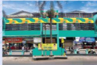
Pasar Bintaro Sektor 2