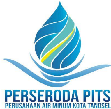
Gambar 2.1 Logo Perseroda PITS

Perseroda PITS (Pembangunan Investasi Tangerang Selatan) merupakan Badan Usaha Milik Daerah (BUMD) kota Tangerang Selatan. Perseroda PITS bergerak di bidang air minum atau Perseroda Khusus Air Minum. PT Pembangunan Investasi Tangerang Selatan resmi berubah menjadi Perseroda atau Perusahaan Perseroan Daerah. Perseroda adalah BUMD yang berbentuk Perseroan terbatas yang modalnya terbagi atas saham yang seluruhnya atau paling sedikit 51% dimiliki oleh 1 daerah.