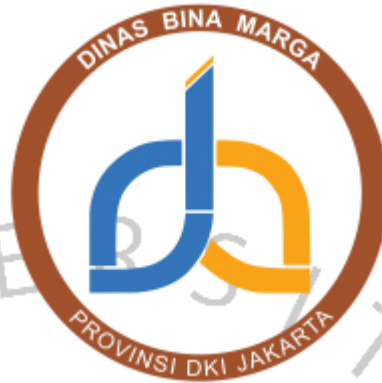
Gambar 2. 4 Logo Dinas Bina Marga Provinsi DKI Jakarta

DKI Jakarta, pemilik proyek tersebut adalah Bidang Jalan dan Jembatan Dinas Bina Marga Provinsi DKI Jakarta.