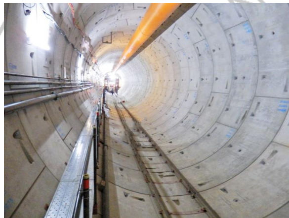
Gambar 2. 8 Proyek Terowongan Mass Rapit Transit (MRT) di Jalan Jenderal Sudirman

Mass Rapit Transit (MRT) merupakan proyek konstruksi yang mulai dilaksanakan pada tahun 2013 dan rampung pada tahun 2018. Pekerjaan konstruksi yang dikerjakan pada proyek ini yaitu dengan membuat terowongan sepanjang 8 meter di bawah tanah yang berada di Jalan Jenderal Sudirman. Peralatan mesin yang digunakan untuk membuat terowongan yaitu Mesin TBM ( Tunnel Boring Machine ) yang dikerjakan oleh kontraktor asal Jepang dan Indonesia, yaitu Jaya Konstruksi, Shimizu, Wijaya Karya, dan Obayashi (Jaya Konstruksi, 2017).