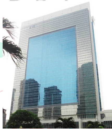
Gambar 2. 9 Puri Indah Financial Tower

Puri Indah Financial Tower merupakan proyek gedung perkantoran yang berada di Jakarta Barat, kawasan Puri Indah. Proyek Puri Indah Financial Tower dilaksanakan oleh PT Jaya Kosntruksi Manggala Pratama, Tbk. Gedung ini dibangun dengan 25 lantai, dilaksanakan pada tahun 2014 dan rampung pada tahun 2015 (Jaya Konstruksi, 2017).