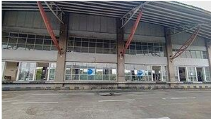
Gambar 2. 10 Terminal Bus Pulo Gebang