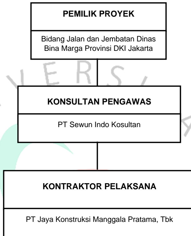
Gambar 2. 3 Struktur Organisasi Proyek Peningkatan/Pembangunan Jalan Arteri Rasuna Said Provinsi DKI Jakarta