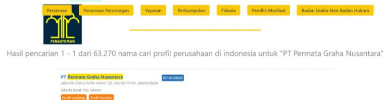
Gambar 2.1 Data AHU PT. Permata Graha Nusantara

Kementerian BUMN menetapkan budaya baru di Kementerian, yaitu “AKHLAK” yang merupakan singkatan dari Amanah, Kompeten, Harmonis, Loyal, Adaptif, dan Kolaboratif. Nilai-Nilai Utama ( Core Values ) Sumber Daya Manusia Badan Usaha Milik Negara dibahas dalam Surat Edaran Menteri BUMN Nomor: SE 7/MBU/07/2020 pada tanggal 1 Juli 2020 (PGNMAS, 2024a). Dengan adanya edaran tersebut, PT. Permata Graha Nusantara (PGNMAS) telah menerapkan psinsip budaya AKHLAK sesuai dengan surat edaran tersebut. Nilai budaya tersebut membuat PT. Permata Graha Nusantara (PGNMAS) berkomitmen untuk membangun budaya kerja yang beretika, profesional dan berkelanjutan, mendukung pertumbuhan perusahaan, serta memberikan manfaat bagi seluruh pemangku kepentingan (PGNMAS, 2024b). Selain itu, PT. Permata Graha Nusantara (PGNMAS) juga telah terdaftar dalam Direktorat Jenderal Administrasi Hukum Umum (AHU) yang tertera pada Gambar 2.1 .