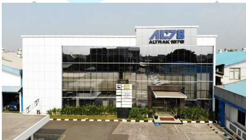
Gambar 2.1 PT ALTRAK 1978 Kantor Pusat

Sebagai Distributor Resmi dan mempunyai jaringan pemasaran dengan lebih dari 40 cabang di seluruh Indonesia, PT ALTRAK 1978 mempunyai komitmen untuk mewujudkan filosofi perusahaan, " Your Total Partner ". Produk yang disajikan mendapat dukungan produk yang memadai seperti ketersediaan suku cadang, teknisi yang terlatih di pabrik, dan pelatihan yang relevan (Altrak, 2022).