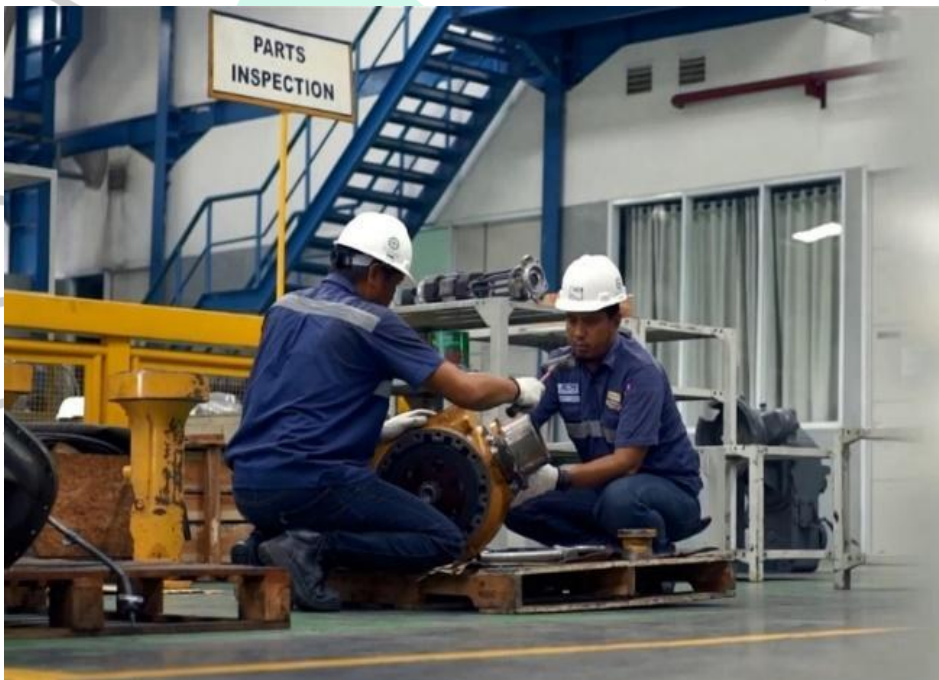
Gambar 2.3 Services PT Altrak 1978 (Altrak, 2022)

produk dari perusahaan tersebut. Alasan dari adanya layanan purna jual yang diberikan kepada pelanggan oleh perusahaan adalah sebagai langkah yang bagus untuk meningkatkan kepuasan pelanggan dan hal tersebut sesuai dengan filosofi perusahaan PT ALTRAK 1978 yaitu “Your Total Partner”. Selain itu juga dapat meningkatkan citra perusahaan dan dapat dipercaya oleh pelanggan atau pembeli karena adanya layanan tersebut. Dalam konteks services , PT ALTRAK 1978 memberikan services dengan teknisi terlatih untuk pergantian spare parts . Perusahaan memberikan pelatihan kepada teknisi dengan pelatihan yang relevan sehingga memberikan hasil yang terbaik.