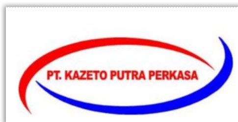
Gambar 2.1 Logo PT. Kazeto Putra Perkasa

Pendidikan yang layak tercapai melalui jalur pendidikan formal, nonformal, dan informal, sehingga setiap anak dapat memilih jalur yang sesuai dengan kebutuhannya. PT Kazeto Putra Perkasa menaungi beberapa lembaga pendidikan, antara lain Kak Seto School , Homeschooling Kak Seto, dan Sekolah Khusus Kak Seto. Kak Seto School menyediakan pendidikan formal dengan kurikulum yang fokus pada pembentukan karakter dan keterampilan anak melalui pendekatan holistik, yang mencakup perkembangan akademis, emosional, sosial, dan fisik. Homeschooling Kak Seto menawarkan pendidikan nonformal yang fleksibel, memungkinkan anak untuk belajar sesuai dengan kebutuhan dan ritme mereka masing-masing. Sekolah Khusus Kak Seto diperuntukkan bagi anak-anak dengan kebutuhan khusus, menyediakan layanan pendidikan inklusif yang memastikan setiap anak menerima dukungan dan perhatian yang diperlukan untuk mengembangkan potensi mereka. Kak Seto Learning Center memberikan layanan Kegiatan Belajar Mengajar (KBM) dan bimbingan siswa secara individu atau kelompok, baik di rumah atau tempat lain, sesuai dengan kesepakatan antara orang tua, anak, dan tutor. Selain itu, unit pelatihan profesional ditujukan untuk meningkatkan keterampilan siswa, kompetensi tenaga pendidik, dan orang tua dalam berkomunikasi dan memahami anak (Dokumen PT. Kazeto Putra Perkasa, 2024). Pada Gambar 2.1 tertera logo dari PT Kazeto Putra Perkasa (Sekolah Kak Seto):