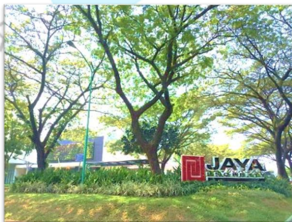
Gambar 2.1 Kantor Pusat PT Jaya Real Property, Tbk

PT Jaya Real Property, Tbk merupakan salah satu perusahaan pengembang properti dan kawasan di Indonesia. Kepemilikan perusahaan ini secara struktural didominasi oleh PT Pembangunan Jaya (63,59%) sementara sisanya dimiliki Publik (36,41%) (PT Jaya Real Property Tbk, 2023). Perusahaan ini berdiri sejak tahun 1979 dan pada awalnya bernama PT Raya Bintaro (PT Jaya Real Property Tbk, 2023). PT Raya Bintaro pada akhirnya berganti nama menjadi PT Jaya Real Property, Tbk pada 4 Mei 1992 dihadapan salah satu notaris di Jakarta (PT Jaya Real Property Tbk (2018)). Perusahaan ini merintis karir dengan menunjukkan eksistensinya melalui tercatatnya saham di Bursa Efek Jakarta pada tahun 1994 dan membangun kota satelit bernama Bintaro Jaya (PT Jaya Real Property Tbk, 2018). PT Jaya Real Property, Tbk kemudian memperluas jangkauannya dalam mengembangkan wilayah yang tidak hanya terbatas pada kawasan Bintaro (Tangerang Selatan) namun juga wilayah Tangerang, Jakarta Barat, Jakarta Selatan, serta Semarang. Gambar 2.1 menunjukkan lokasi kantor pusat PT Jaya Real Property saat ini, yakni di CBD Emerald Blok CE/A No. 1, Jl. Boulevard Bintaro Jaya, Tangerang Selatan.