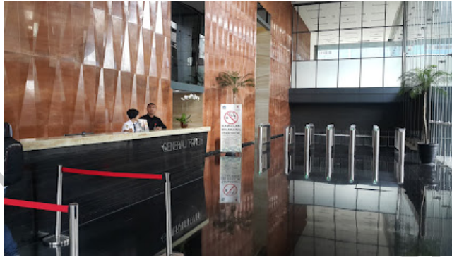
Gambar 1. 1 Lobby PT. Asuransi Jiwa Generali Indonesia