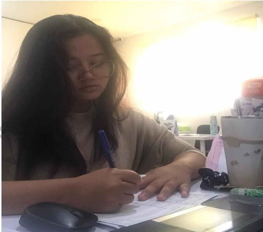
Gambar 3.10 Praktikan sedang memeriksa pembukuan harian