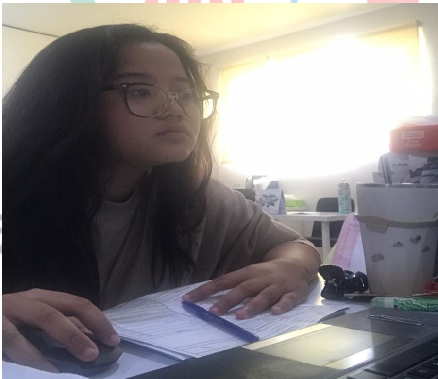
Gambar 3.11 Praktikan sedang melakukan revisi program admin