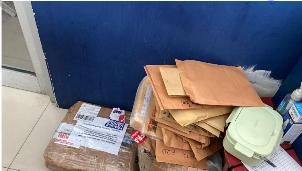
Gambar 3.8 Dokumen/Paket

setoran harian akan mengambil dokumen atau paket tersebut dari Customer Service, setelah itu kita akan mencatat apa saja dan dari toko mana saja paket yang sudah kita terima, sebagai bukti tanda terima dari Customer Service. Kemudian setelah dicatat, kita akan membuka paket-paket tersebut dan apabila ada paket yang harus diberikan kepada divisi-divisi lain, maka akan segera kita catat di buku tanda terima, dan kita serahkan ke bagian divisi nya masing-masing.