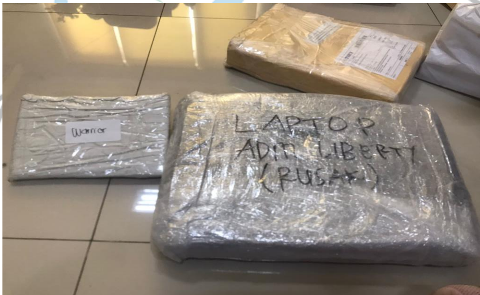
Gambar 3.9 Paket untuk bagian mintenance