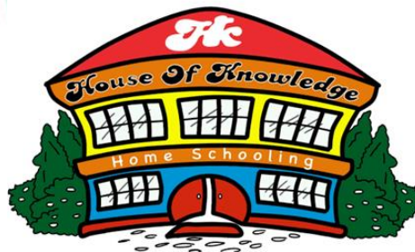
Gambar 2.2. Logo PKBM House Of Knowledge (2024)

Berdasarkan hasil wawancara dengan ketua dan salah satu guru di PKBM House Of Knowledge, logo dari PKBM House of Knowledge memiliki makna yang diambil dari bentuk rumah. Logo tersebut menggambarkan konsep " Home Schooling " yang melambangkan kenyamanan, perlindungan serta suasana pembelajaran yang lebih personal dan nyaman, seperti di rumah bagi para siswa. Rumah juga memberikan tempat yang aman dan penuh kasih sayang sesuai dengan Motto PKBM HOK yaitu " The Second Home For Your Children " yang artinya sekolah ini dapat menjadi rumah kedua bagi anak-anak (PKMB House Of Knowledge, 2024). Gambar 2.2 merupakan logo PKBM House Of Knowledge.