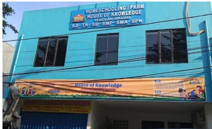
Gambar 2.1. PKBM House Of Knowledge Pusat

PKBM House Of Knowledge terus berkembang seiring waktu, jumlah pendaftar juga semakin meningkat terutama pada tahun 2019 hingga 2020. Terdapat sekitar 230 siswa yang bersekolah di ketiga cabang PKBM HOK. Sebagian besar siswa atau sekitar 70% siswa merupakan anak berkebutuhan khusus, sedangkan 30% siswa merupakan anak normal. Jumlah guru di PKBM HOK saat ini mencapai lebih dari 50 guru, yang didalamnya termasuk dengan guru pendamping. PKBM House of Knowledge juga telah menjalin berbagai kerja sama, di antaranya mendirikan Taman Bacaan Masyarakat (TBM) bersama komunitas Masyarakat Gemar Membaca (MAGMA) dan bermitra dengan Mom N Jo (Hok Homeschool, 2024).