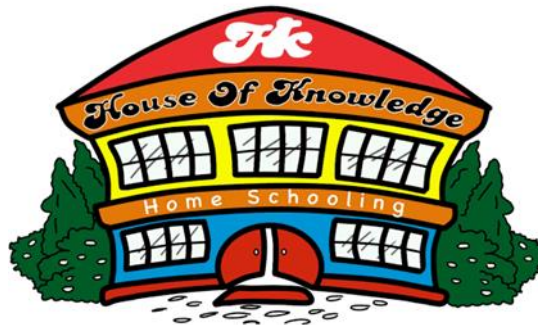
Gambar 2. 1 Logo PKBM HOK