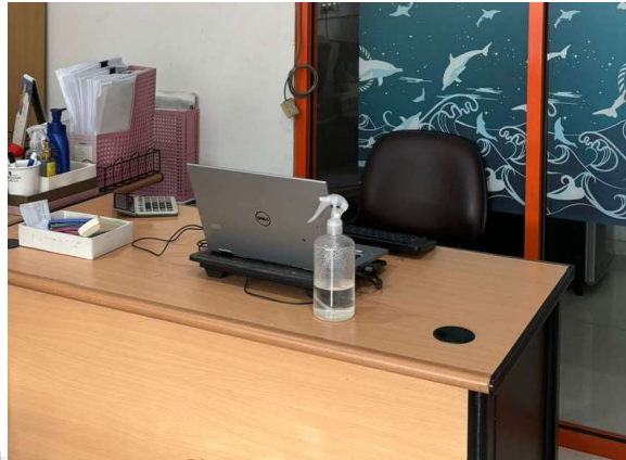
Gambar 3.1 Meja Kerja Praktikan

Tugas-tugas yang diberikan kepada Praktikkan: