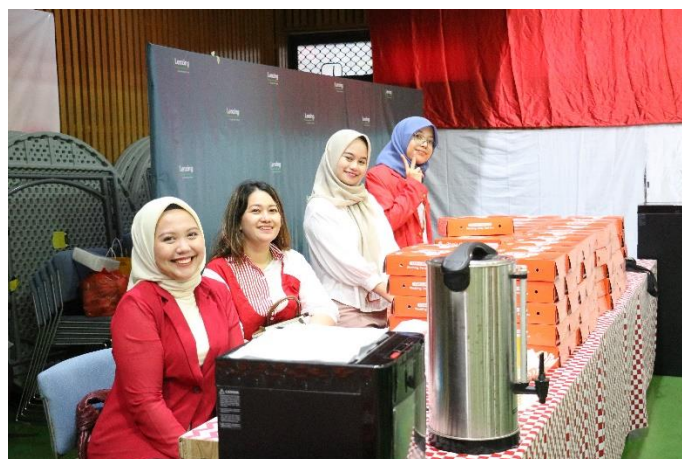
Lampiran 2. 5 Dokumentasi Foto HUT RI-79 - 3