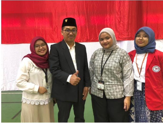
Lampiran 2. 6 Dokumentasi Foto HUT RI-79 - 4