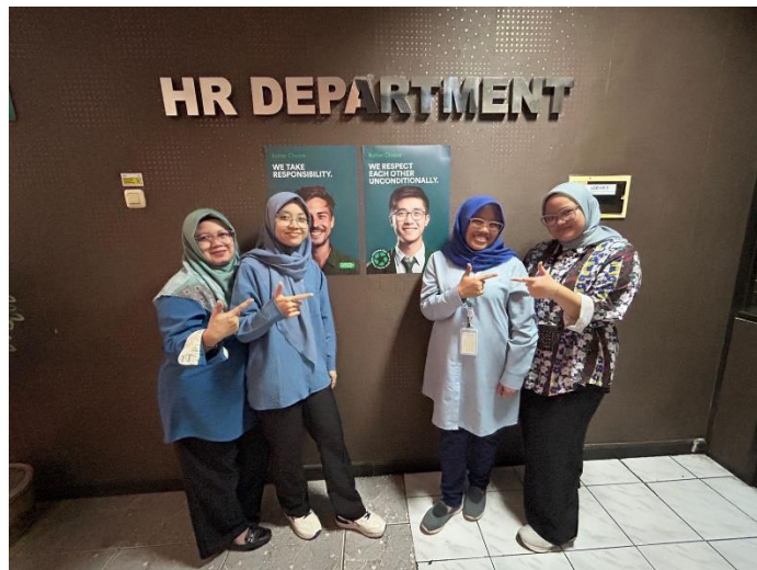
Lampiran 2. 2 Dokumentasi Foto Departemen - 2