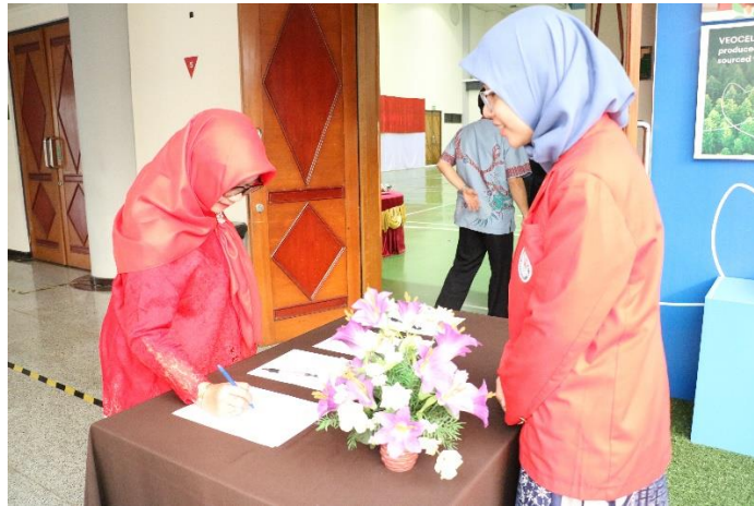
Lampiran 2. 3 Dokumentasi Foto HUT RI-79 - 1