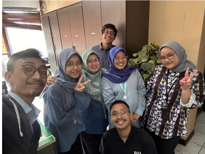
Lampiran 2. 1 Dokumentasi Foto Departemen - 1