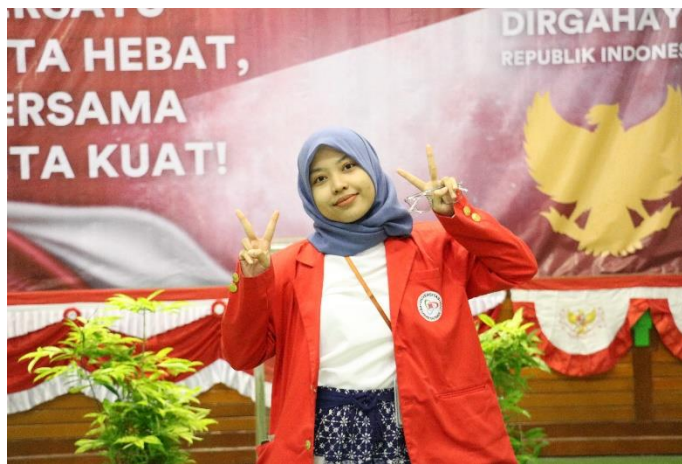
Lampiran 2. 4 Dokumentasi Foto HUT RI-79 - 2