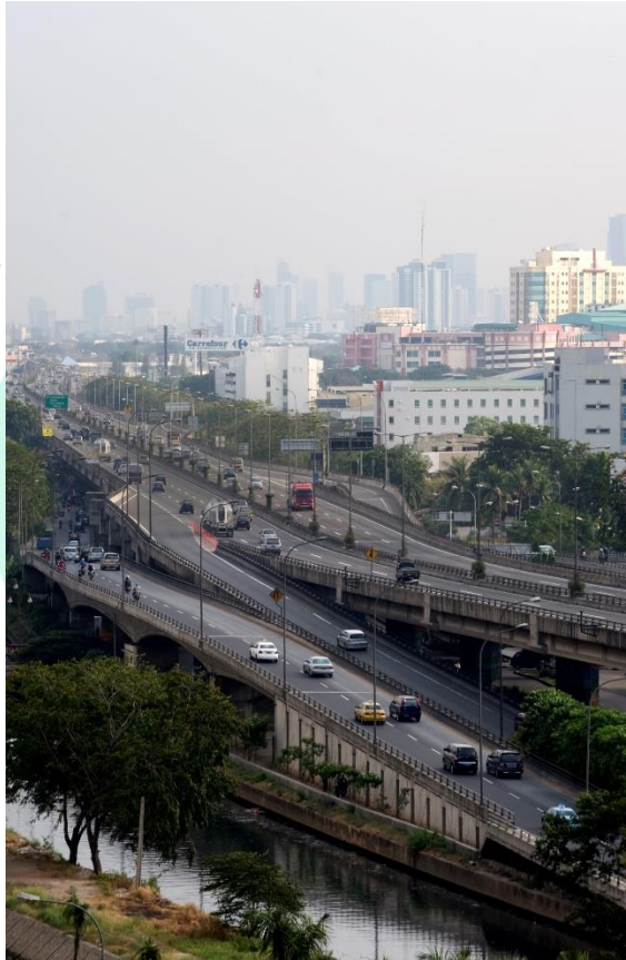
Gambar 2. 2 Cawang Priok Yos Sudarso

dan anak perusahaannya, PT Sarana Tirta Utama. Pada Juli 2013, perusahaan melakukan penerbitan saham baru untuk mendukung investasi di infrastruktur baru, termasuk jalan tol dan fasilitas pasokan air, serta ekspansi kapasitas di PT Jaya Beton dan PT Jaya Trade. Pada tahun yang sama, perusahaan melakukan pemecahan saham untuk meningkatkan likuiditas.