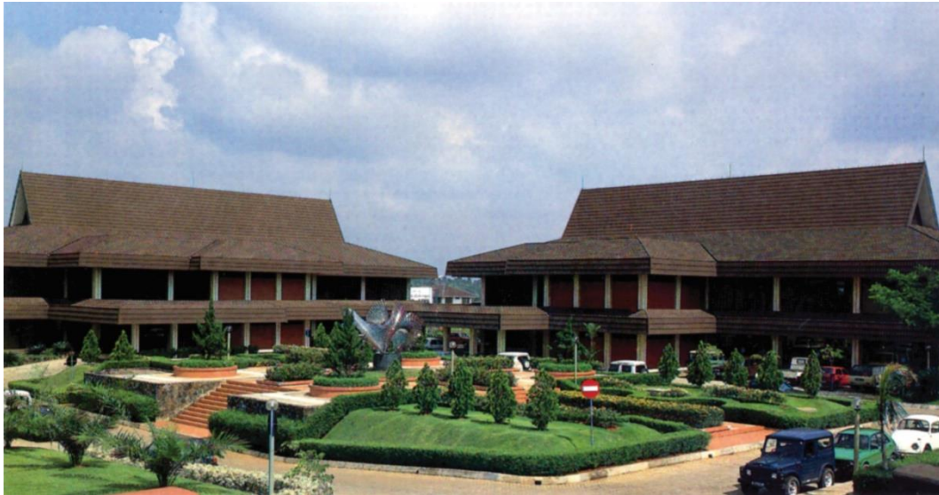
Gambar 2. 1 Gedung pertama PT Jaya Konstruksi Manggala Pratama, Tbk

PT Jaya Konstruksi Manggala Pratama, Tbk., merupakan bagian dari Grup Jaya, adalah perusahaan infrastruktur terintegrasi dengan fokus utama di bidang konstruksi infrastruktur dan bangunan, perdagangan aspal dan bahan bakar LPG, pabrikasi beton pracetak, serta layanan mekanikal, elektrikal, dan pemeliharaan. perusahaan ini merupakan Divisi Kontraktor di PT Pembangunan Jaya sebelum berdiri sendiri sebagai entitas hukum pada 23 Desember 1982, dan kemudian mencatatkan sahamnya di Bursa Efek Indonesia (BEI) pada Desember 2007.