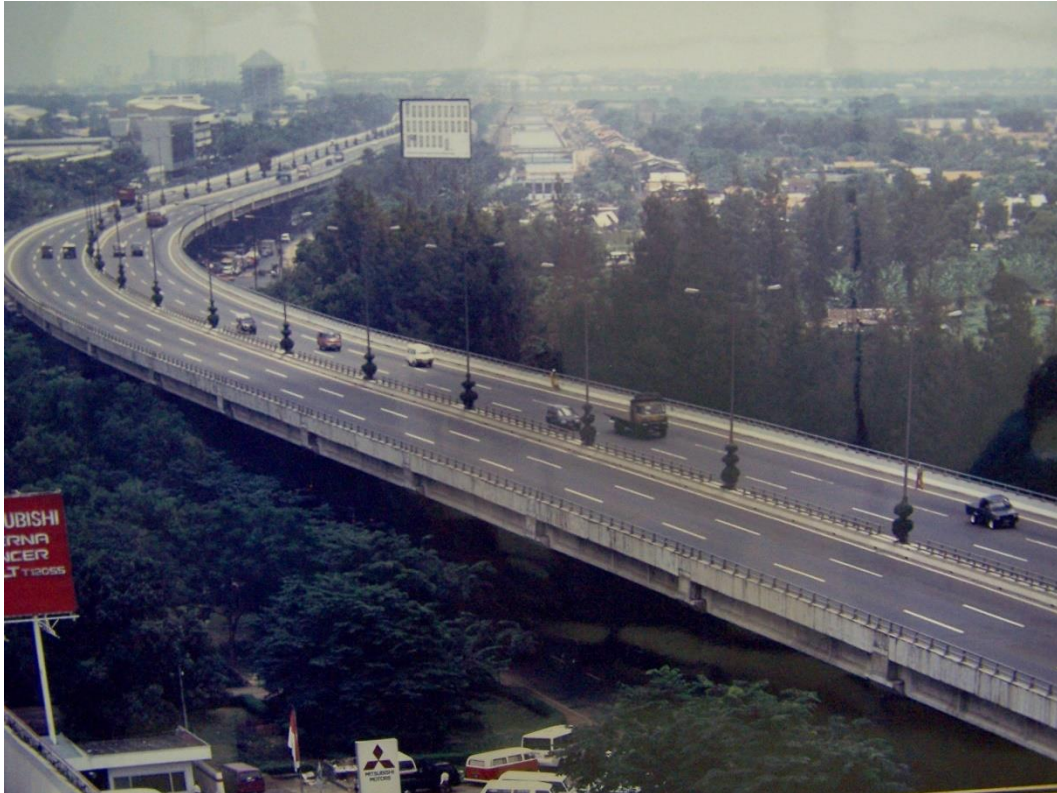
Gambar 2. 5 Cawang Priok 1988

PT Jaya Konstruksi Manggala Pratama Tbk adalah perusahaan konstruksi terkemuka di Indonesia yang memiliki peran besar dalam pembangunan infrastruktur dan properti di seluruh negeri. Kegiatan perusahaan ini melibatkan