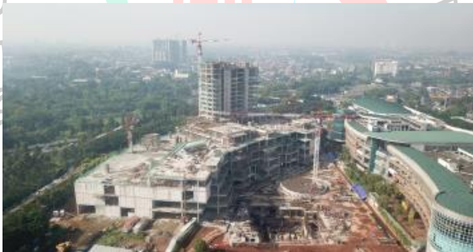
Gambar 2. 6 Pembuatan BX2

Perusahaan juga mengerjakan proyek-proyek sipil, seperti pembangunan bendungan, saluran irigasi, serta fasilitas kelistrikan yang esensial untuk mendukung ketahanan energi dan distribusi air di Indonesia. Pada sektor energi, Jaya Konstruksi turut andil dalam pengembangan dan konstruksi fasilitas pembangkit listrik, baik tenaga air, panas bumi, maupun tenaga surya, mendukung transisi Indonesia menuju energi terbarukan dan pengurangan ketergantungan terhadap bahan bakar fosil.