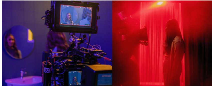
Gambar 2. 4 Stephanie Poetri "Paranoia"

Stephanie Poetri yang terkenal dengan rilisan singlenya yang berjudul "I Love You 3000", pada tahun 2021 baru saja merilis single terbarunya berjudul "Paranoia" yang tergabung dalam album "AM:PM", ARALOKA STUDIOS dengan Maspam Record berkesempatan untuk berkerjasama dalam sebuah Proyek Musik Video dari Stephanie Poetri Mulai dari proses Pra production sampai tahap Post Production .