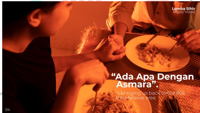
Gambar 2. 5 Lomba Sihir "Apa Ada Asmara"

Pada Tahun 2021 ARALOKA STUDIOS berkesempatan Untuk mengerjakan proyek Musik Video dari Band yang Bernama Lomba Sihir yang tergabung dalam Sun Eater Team , merupakan Perusahaan music independen Yang didirikan pada tahun 2019, Berjudul "Apa Ada Asmara" ARALOKA STUDIOS Mengerjakana Musik Video ini Mulai Dari Pra Production sampai Post Production.