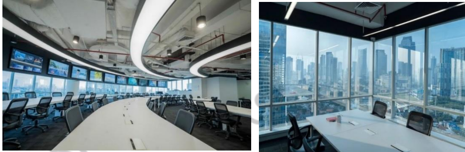
Gambar 2. 2 Tempat Kerja Profesi Praktikan

hidup profesional. Mereka juga berkomitmen untuk menjadi platform berita yang independen dan kredibel, serta mendukung pertumbuhan ekonomi di Indonesia dengan menyajikan informasi yang relevan dan mendalam.