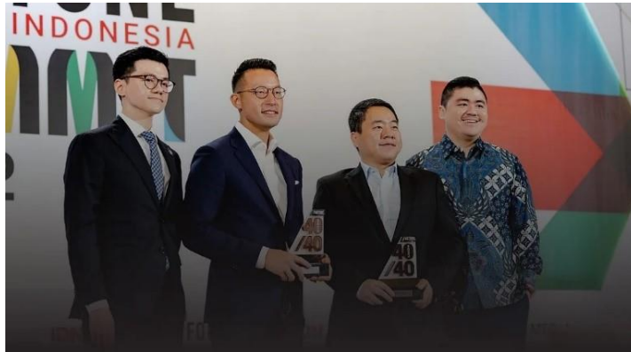
Gambar 2. 4 Acara Fortune Indonesia Summit.

Fortune Indonesia Summit merupakan konferensi bisnis tahunan yang diselenggarakan oleh IDN Media yang mempertemukan para pemimpin bisnis, wirausahawan, dan pengambil keputusan dari berbagai industri. Tujuan dari acara ini adalah untuk menyediakan wadah untuk mendiskusikan berbagai topik bisnis, ekonomi dan teknologi serta membina kerja sama menuju pembangunan ekonomi berkelanjutan di Indonesia.