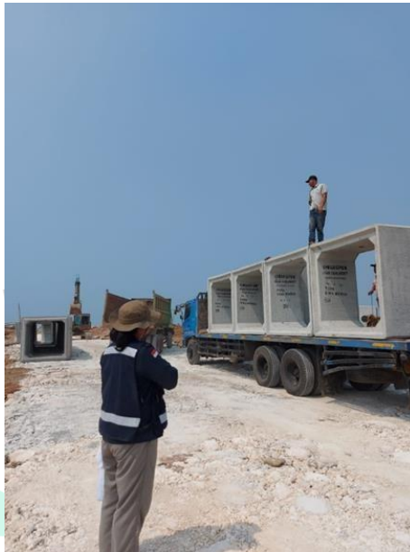
Gambar 2.2 Proses Checklist Material