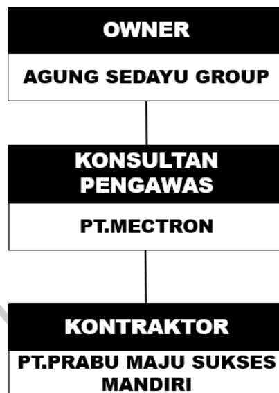
Gambar 2.2 (a) Struktur Organisasi (PT Prabu Maju Sukses Mandiri, 2023)