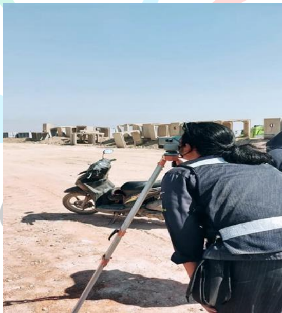
Gambar 2.3 Proses Checklist Material

Menentukan elevasi dasar memiliki tujuan untuk menentukan dasar dan ketebalan suatu permukaan. Pekerjaan ini dilakukan pada pemasangan sub grade , sub base course , dan base course . Terdapat gambar proses penentuan elevasi dasar.