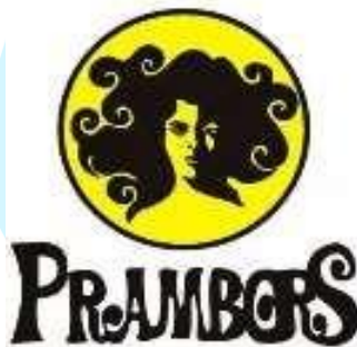
Gambar 1. 1 Logo Prambos