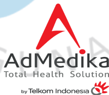
Gambar 2.1 Logo Admedika

PT. Administrasi Medika, juga dikenal sebagai AdMedika, didirikan pada tahun 2002. Pada tahun 2010, PT Multimedia Nusantara, juga dikenal sebagai TelkomMetra, bergabung dengan Telkom Group. Tiga kategori utama layanan kesehatan AdMedika adalah Manajemen Klaim Asuransi Kesehatan, Aplikasi MyAdMedika, dan Layanan Manajemen Fasilitas Kesehatan. Setiap kategori menawarkan berbagai layanan untuk membantu pasien mendapatkan layanan medis kapan saja dan di mana saja. AdMedika berkembang dari perusahaan administrasi pihak ketiga (TPA) menjadi penyedia layanan kesehatan lengkap pada tahun 2016. Sejalan dengan visi dan pasar AdMedika, langkah strategis ini meningkatkan posisi AdMedika sebagai pemimpin pasar.