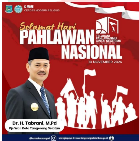
Gambar 2.3 Desain Hari Pahlawan