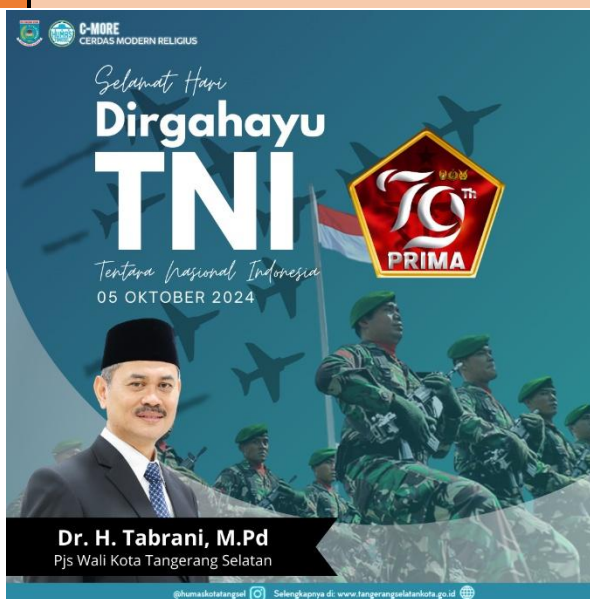
Gambar 2.4 Desain Konten Dirgahayu TNI