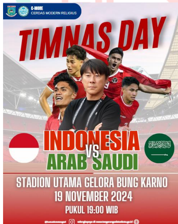
Gambar 2.6 Hasil Desain untuk Hari Timnas