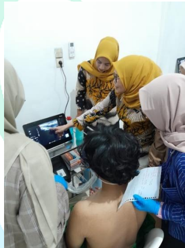
Gambar 2. 5 Workshop PAIN DRE di aceh