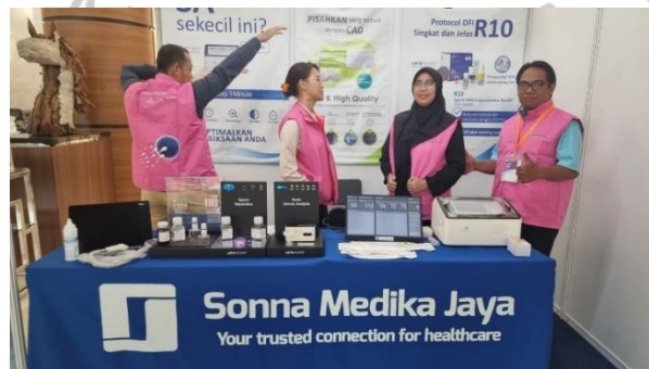
Gambar 2. 6 Event Hiferi