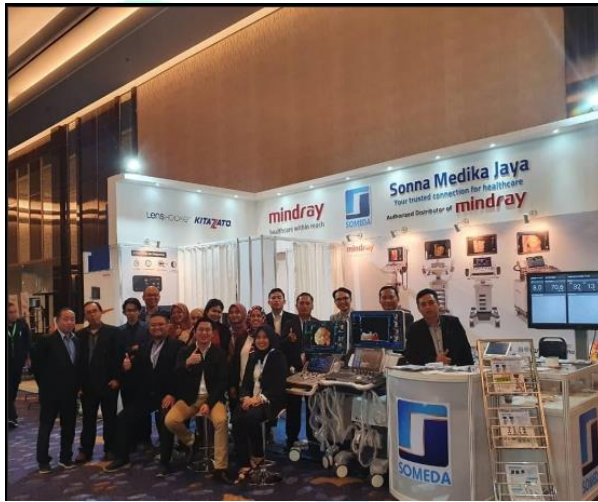
Gambar 2. 8 Event PIT FETOMATERNAL XXII Bali