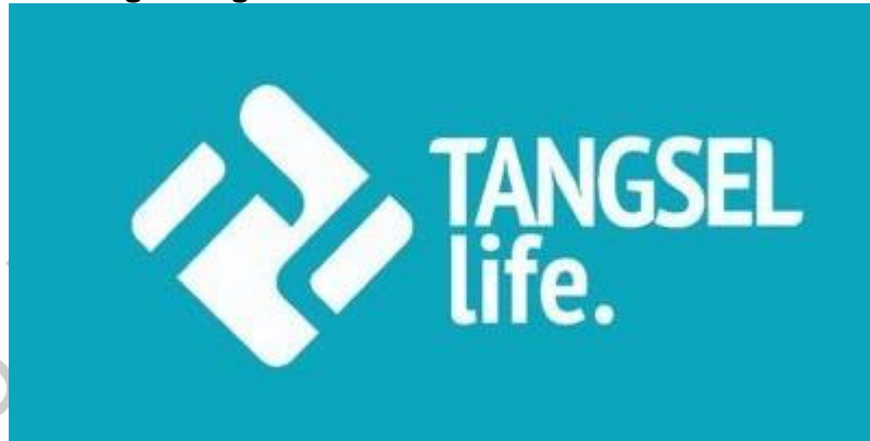
Gambar 2. 1 Logo Tangsel Life

Logo PT. Tangselife Media Utama terinspirasi dari warna logo khas Kota Tangerang Selatan yakni berwarna biru, Tangsel Life menggunakan warna tersebut dikarenakan menggunakan nama tangsel dan selalu memberikan informasi seputar Kota Tangerang Selatan. Berdasarkan nama media nya yakni "Tangsel Life" yang mengartikan "Kehidupan Tangsel" yang dikemas dalam suatu media serta bentuk belah ketupat dan berisikan singkatan "TL" juga menggambarkan kincir atau roda kehidupan masyarakat Kota Tangerang Selatan.