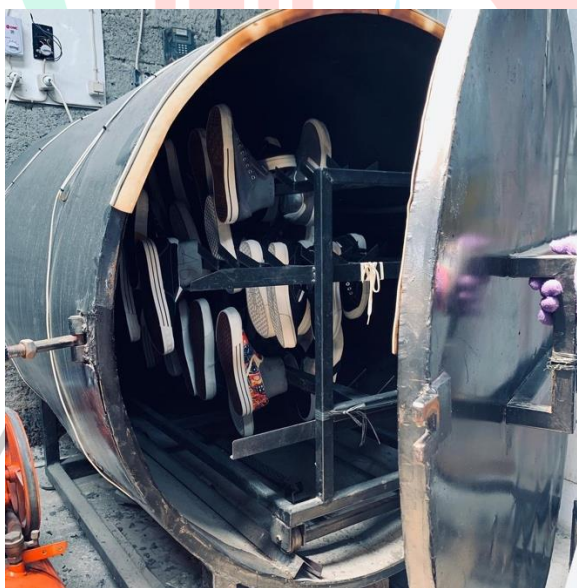
Gambar 1 Proses Produksi Sepatu Polos MadeByYou

Polos.MadeByYou merupakan anak perusahaan dari PT Rayo Wijaya Abadi. Didirikan pada tahun 2019, perusahaan ini memulai perjalanan bisnisnya dengan menawarkan layanan reparasi sepatu. Seiring dengan meningkatnya permintaan pelanggan akan produk yang lebih personal dan unik, Polos.MadeByYou bertransformasi menjadi penyedia sepatu custom . Dari sinilah brand Polos.MadeByYou lahir, yang kini dikenal sebagai merek sepatu yang menyediakan produk berkualitas dengan desain yang dapat disesuaikan sesuai keinginan pelanggan, memenuhi kebutuhan akan sepatu yang autentik dan ekspresif.