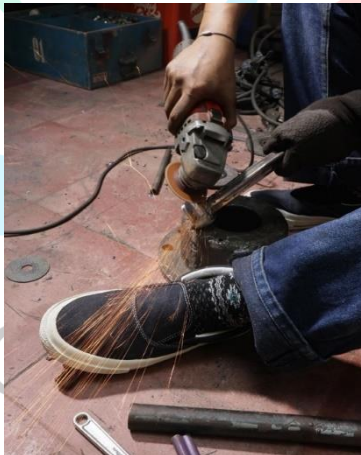
Gambar 4 Hasil foto produk sepatu Kolaborasi Komunitas Bengkel Wawoke Garage