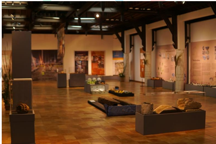
Gambar 2. 5 Pameran di Bentara Budaya

Pameran yang diadakan di Bentara Budaya merupakan salah satu sarana untuk mempromosikan karya-karya seni, budaya, serta produk-produk unggulan dari Kompas Gramedia kepada masyarakat luas. Pameran ini juga menjadi ajang untuk memperkenalkan nilai-nilai perusahaan.