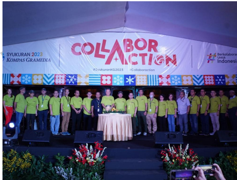
Gambar 2. 8 Syukuran KG 2023

Syukuran KG adalah kegiatan yang diadakan setiap tahun untuk merayakan pencapaian-pencapaian yang telah diraih oleh Kompas Gramedia selama setahun penuh. Kegiatan ini juga bertujuan untuk mempererat hubungan antara sesama karyawan dan memberikan apresiasi terhadap kontribusi mereka.