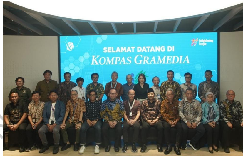
Gambar 2. 6 Kunjungan Kementerian Sosial RI ke Kompas Gramedia

Kegiatan ini bertujuan untuk mempererat kerjasama dan komunikasi dalam rangka mendukung tujuan perusahaan.