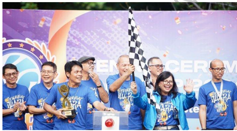
Gambar 2. 9 Opening Ceremony KG CUP 2024

KG Cup adalah kompetisi olahraga yang diadakan untuk seluruh warga Kompas Gramedia. Kegiatan ini bertujuan untuk meningkatkan kekompakan, kebersamaan, serta menjaga kesehatan di kalangan karyawan melalui berbagai cabang olahraga yang dilombakan.