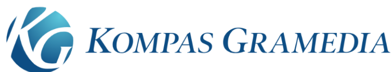
Gambar 2. 2 Logo Kompas Gramedia

Sejak awal terbentuknya, Kompas Gramedia berpegang teguh pada semangat untuk mencerahkan bangsa dan manusia dengan menghidupi slogan "enlightening people" melalui lebih dari 400 jaringan usaha di seluruh Indonesia, CEO Kompas Gramedia Lilik Oetama, menyampaikan bahwa Kompas Gramedia hadir sebagai Indonesia mini yang berkontribusi untuk melakukan perubahan relevan dan berkembang sebagai aset bangsa Indonesia dengan nilai kemanusiaan dan integritas sebagai kunci utamanya (Wahyono, 2020).