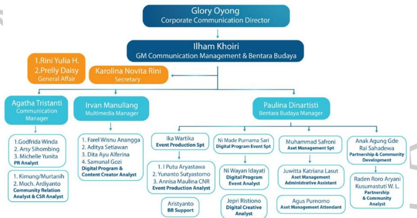
Gambar 2. 4 Struktur Organisasi Corporate Communication Kompas Gramedia

Untuk melaksanakan tugasnya, Kompas Gramedia memiliki unit Corporate Communication yang berperan sebagai pusat informasi dan komunikasi perusahaan, baik untuk kebutuhan internal maupun eksternal. Unit ini terbagi ke dalam beberapa divisi yang dirancang untuk memperlancar alur kerja karyawan. Berikut adalah struktur organisasi dari Corporate Communication Kompas Gramedia.