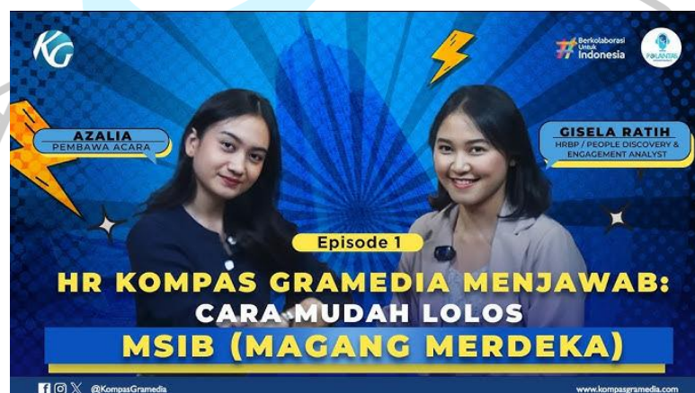
Gambar 2. 7 Thumbnail Video Youtube Polantas

Podcast Polantas merupakan salah satu media komunikasi yang digunakan oleh Kompas Gramedia untuk berbagi informasi, cerita, serta diskusi menarik seputar dunia media, teknologi, dan industri kreatif. Podcast ini berfungsi sebagai saluran untuk meningkatkan hubungan komunikasi di dalam perusahaan maupun dengan audiens eksternal.