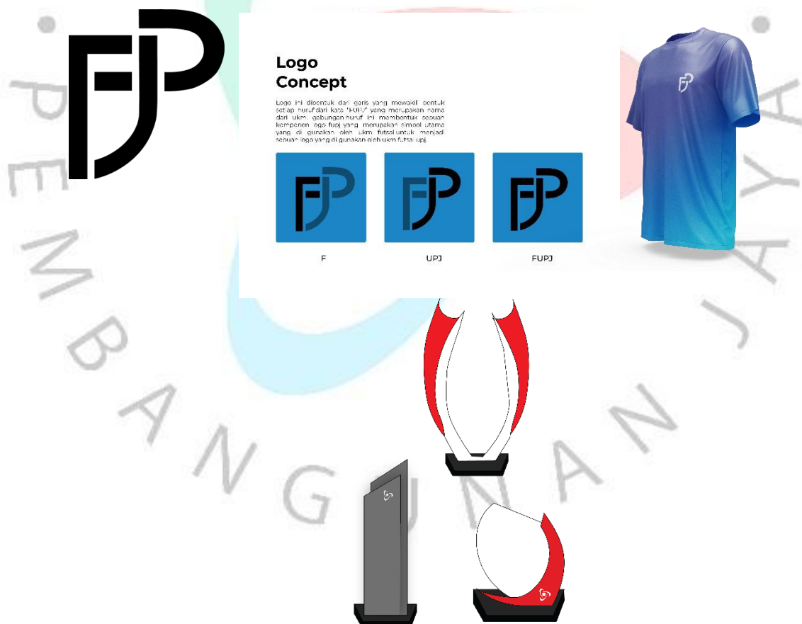
Gambar 3 7 Desain Plakat

Pada tahap ini, praktikan diberi kepercayaan untuk membuat sebuah desain plakat, dalam proses pembuatan, melewati beberapa tahapan seperti brief, desain, revisi serta hasil akhir pada desain Untuk Plakat sesuai dengan yang di brief.