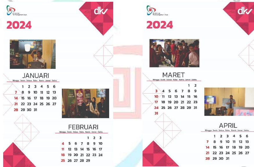
Gambar 3 3Kalender Non Formal DKV