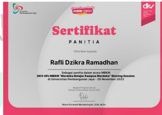
Gambar 3 8 Desain Sertifikat MSIB.

Pada tahap ini, praktikan diberi kepercayaan untuk memasukan nama untuk peserta, dalam proses pembuatan, melewati beberapa tahapan seperti brief, desain, revisi serta hasil akhir pada desain Untuk Plakat sesuai dengan yang di brief.