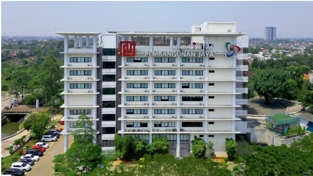
Gambar 2. 1 Universitas pembangunan Jaya

Universitas Pembangunan Jaya (UPJ) didirikan oleh Yayasan Pendidikan Jaya, sebuah lembaga pendidikan yang berada di bawah naungan Grup Pembangunan Jaya, yang dikenal sebagai salah satu pelopor pembangunan perkotaan di Indonesia. UPJ berdiri dengan visi untuk menjadi universitas unggulan yang menghasilkan lulusan berkualitas dan berkontribusi dalam membangun masyarakat yang berkelanjutan (Jaya, 2019).