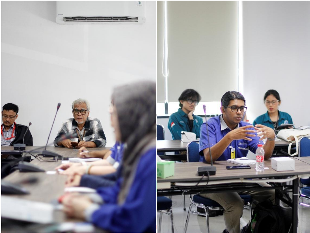
Gambar 3. 5 Kunjungan Universitas Malaysia Sarawak