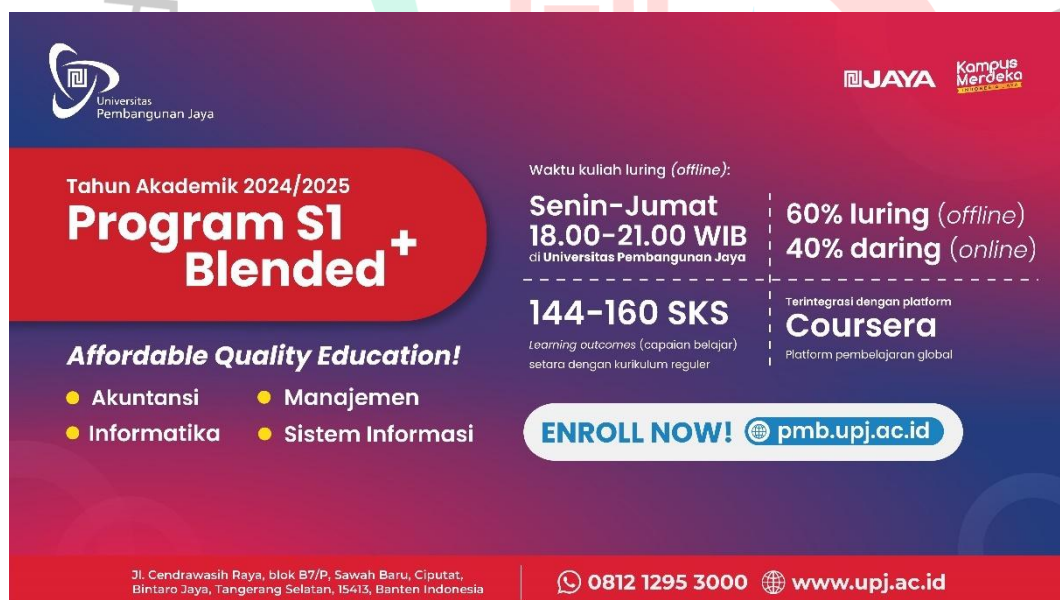
Gambar 3. 2 Desain Web banner Program S1 Blended Plus

Praktikan telah diberi arahan untuk menggunakan ukuran desain 1280 x 720 px untuk web banner dibagaa Landing page. Universitas Pembangunan Jaya memiliki konsep tema Modern dan Profesional. Font yang digunakan adalah family font Poppins.