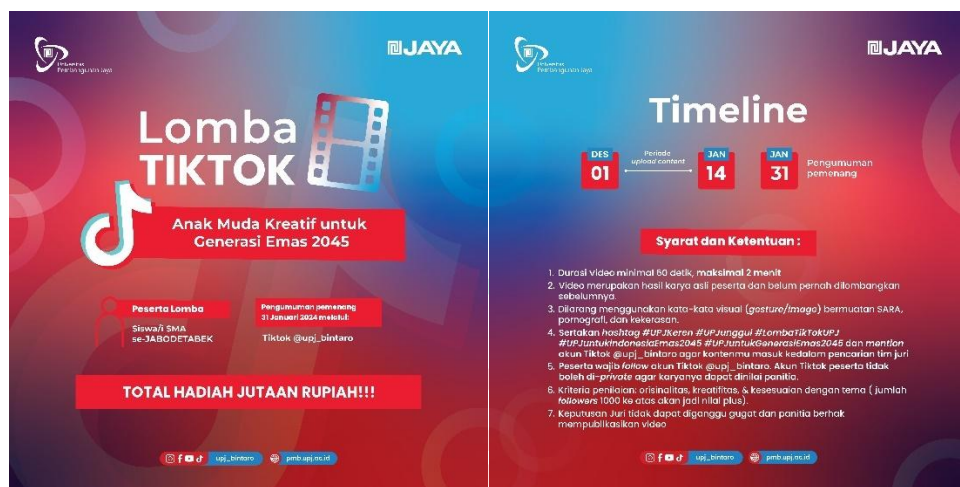
Gambar 3. 3 Desain Feed Media Sosial Instagram UPJ

Praktikan telah diberikan brief untuk menggunakan ukuran desain 1080 x 1080 px. Praktikan membuat desain dengan menjaga konsep Modern dan Profesional yang dimiliki Universitas Pembangunan Jaya. Menggunakan elemen-elemen desain yang relevan untuk menyampaikan pesan yang ditawarkan Universitas Pembangunan Jaya kepada audiensnya.