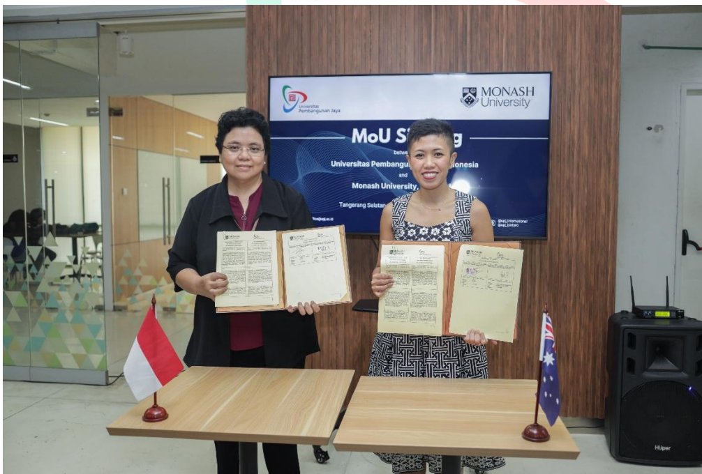
Gambar 3. 8 UPJ dan Monash University, Indonesia Teken MoU untuk Beasiswa S2