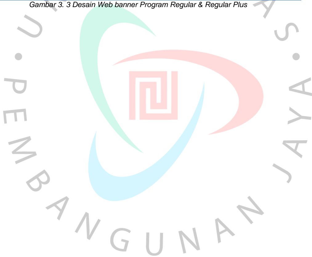
Gambar 3. 3 Desain Web banner Program Regular & Regular Plus