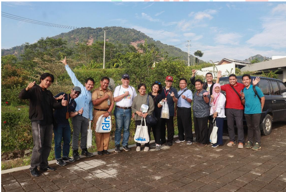
Gambar 3. 6 Kunjungan ke kampung Ilmu Purwakarta