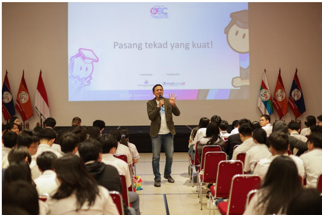
Gambar 3. 9 Beasiswa OSC roadshow di UPJ