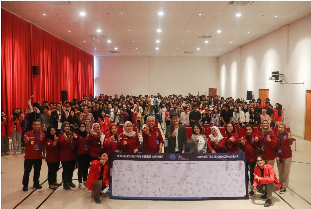
Gambar 3. 7 UPJ Berkolaborasi dengan BNN dan PMI Peringati Hari Anti Narkotika Internasional 2024