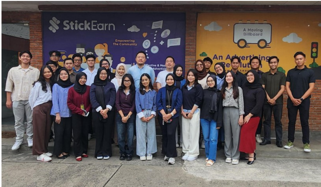
Lampiran 6 Dokumentasi On Boarding MSIB 7