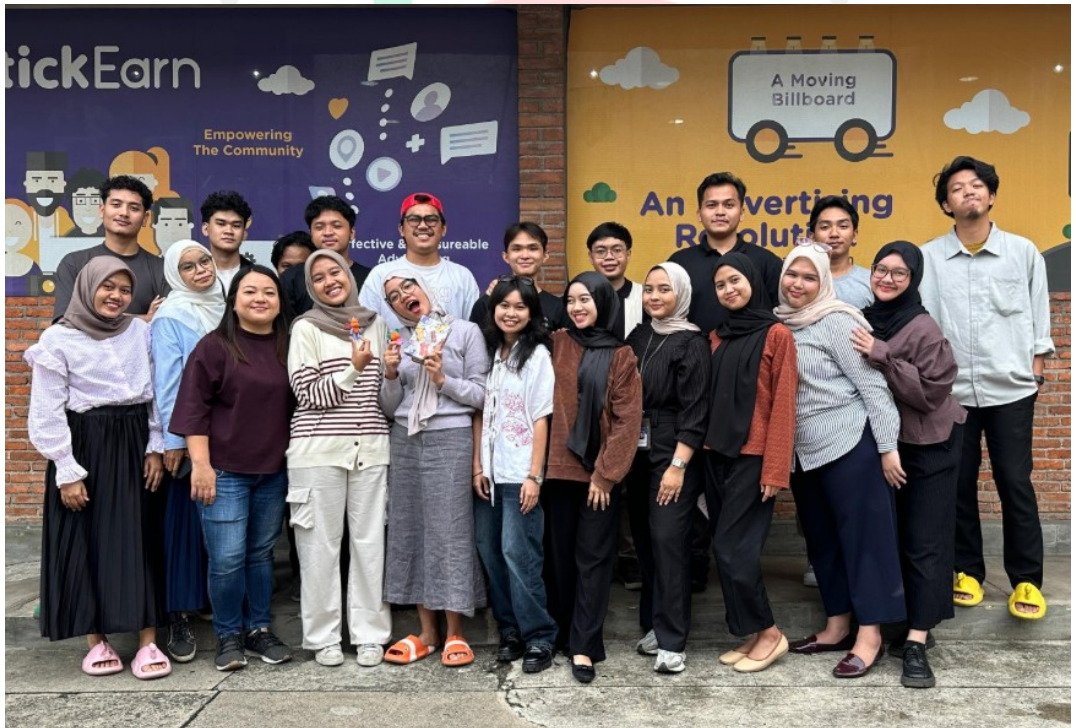
Lampiran 7 Dokumentasi Divisi Marketing dan Desain