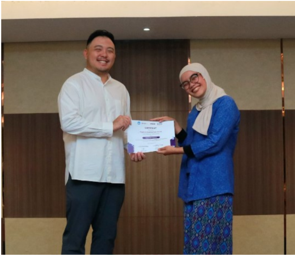
Lampiran 8 Dokumentasi Penyerahan Sertifikat MSIB 7 oleh Founder StickEarn