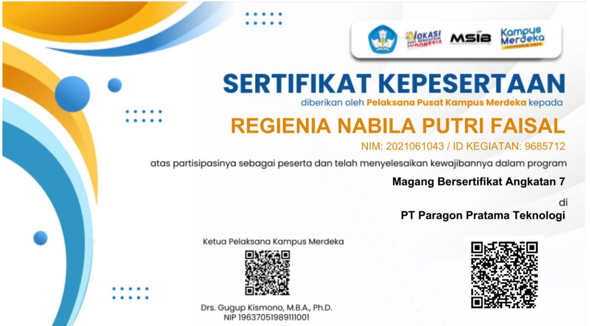
Lampiran 3 Sertifikat MSIB 7 dari Pihak Kampus Merdeka