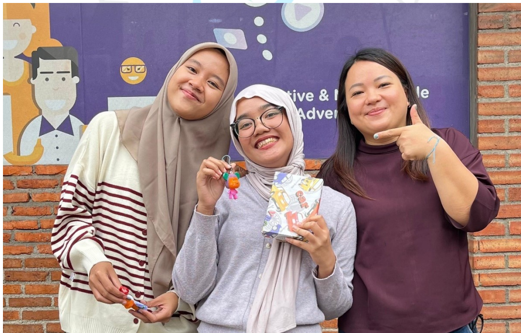
Lampiran 9 Dokumentasi Praktikan Bersama Mentor