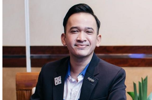
Gambar 2. 2 Pendiri PT. Media Onsu Perkasa

hiburan berkualitas dan relevan menjadikan kanal ini sangat diminati di era digital saat ini.