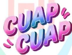
Gambar 2. 8 Cuap-Cuap Logo