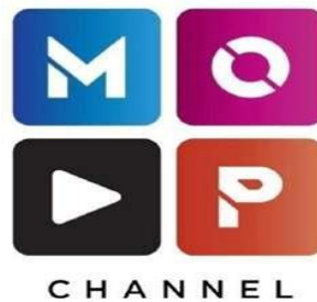
Gambar 2. 1 Logo PT. Media Onsu Perkasa

PT. Media Onsu Perkasa, yang lebih dikenal sebagai MOP Channel, adalah perusahaan media digital yang berbasis di Indonesia dan memiliki misi untuk menyajikan konten hiburan yang segar, relevan, dan inovatif bagi masyarakat. Sejak didirikan, perusahaan ini telah menetapkan standar baru dalam industri hiburan digital dengan menghadirkan konten berkualitas yang mencakup berbagai genre dan format. Dengan visi menjadi pelopor di arena hiburan berbasis digital, MOP Channel terus berkembang dan beradaptasi dengan dinamika kebutuhan masyarakat modern.