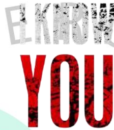
Gambar 2. 5 I Know You Logo