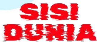
Gambar 2. 4 Logo Sisi Dunia