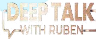
Gambar 2. 6 Deep Talk With Ruben Logo

Deep Talk With Ruben merupakan salah satu program talkshow yang membahas lebih dalam mengenai kisah dari para narasumber yang sedang ramai di perbincangkan, Program Deep Talk With Ruben ini dipandu langsung oleh Ruben Onsu sebagai host dan akan mengulik lebih dalam mengenai kisah atau cerita yang dialami oleh para narasumber. Narasumber Program Deep Talk With Ruben terkadang para selebriti maupun masyarakat biasa yang sedang ramai di perbincangkan.