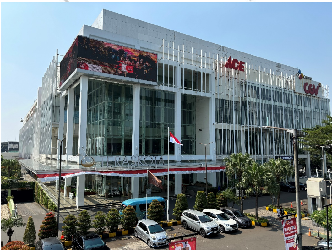
Gambar 2. 1 Mal Teraskota Entertainment Center

Teraskota adalah pusat perbelanjaan yang berlokasi di BSD City, Tangerang Selatan. Mall ini mengusung konsep Entertainment Center Mall sebagai tempat rekreasi keluarga. Berdiri di atas lahan seluas 2 hektar, Teraskota mulai beroperasi dan dibuka untuk umum pada tahun 2009. Pengelolaan mall ini berada di bawah tanggung jawab PT. Deyon Resources sebagai manajemen pengelola.