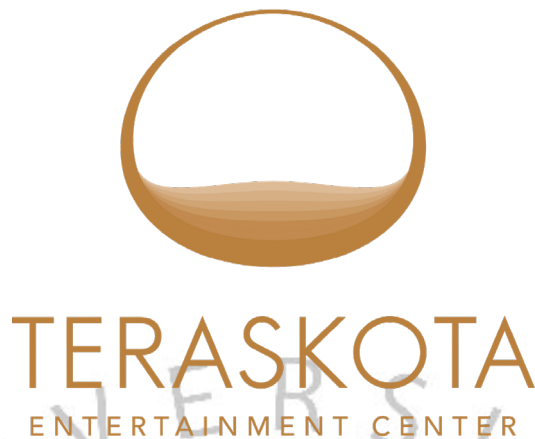
Gambar 2. 3 Logo Perusahaan Mal Teraskota Entertainment Center

Logo Teraskota Entertainment Center memiliki bentuk oval, melambangkan alam semesta, garis lengkungan yang mempresentasikan bentuk teras. Warna dominan pada logo yaitu coklat yang menggambarkan sebagai tanah. Makna dari logo adalah menjadi teras bagi masyarakat yang ingin berkumpul untuk melakukan aktivitas menyenangkan bersama orang terdekat di tengah padatnya perkotaan.