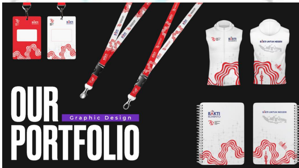
Gambar 2.1 Graphic Design Kominfo

PT Kriyanetra menyediakan layanan pengembangan produk yang membantu perusahaan dalam merancang dan menciptakan produk yang sesuai dengan kebutuhan pasar dan tren terkini. Melalui pendekatan yang berbasis riset pasar dan analisis yang mendalam, perusahaan membantu klien merancang produk yang tidak hanya inovatif, tetapi juga memiliki daya saing yang tinggi di pasar. Layanan ini mencakup segala aspek pengembangan produk, mulai dari perencanaan, desain, hingga implementasi yang memastikan produk yang dihasilkan dapat memenuhi harapan konsumen dan kebutuhan industri.