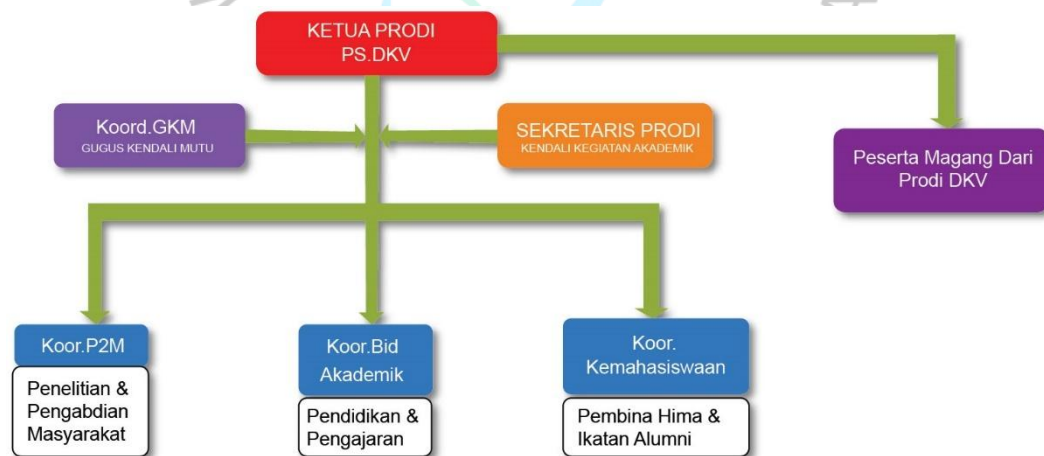
Gambar 2. 3 Struktur Organisasi Prodi DKV