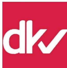
Gambar 2. 2 Logo Program Studi DKV UPJ

Universitas Pembangunan Jaya (UPJ) adalah suatu Universitas swasta di Kabupaten Tangerang Selatan didirikan pada tahun 2011. Cita-cita tersebut diwujudkan melalui pendirian lembaga Pendidikan Jaya tanggal 3 September 1991 yang menaungi pendidikan pada tingkat TK, SD, dan SMP, perguruan tinggi telah ada di Bintaro sejak tahun 1992. Lembaga Pendidikan Jaya berinisiatif buat membangun Universitas bernama Universitas Pembangunan Jaya yang berdiri tahun 2011. Berbekal motto “Integritas, Profesionalisme dan Kewirausahaan”, UPJ adalah sebuah pembelajaran pusat di mana siswa dapat memperoleh pengetahuan yang berkualitas.