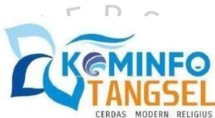
Gambar 2.1 Logo Dinas Komunikasi dan Informatika

Dinas Komunikasi dan Informatika Kota Tangerang Selatan bertugas dalam bidang komunikasi, informatika, persandian, dan statistik. Sebelumnya, instansi ini dikenal sebagai Dinas Perhubungan, Komunikasi, dan Informatika yang dibentuk lewat Peraturan Daerah Kota Tangerang Selatan Nomor 6 Tahun 2010. Dinas ini mendukung Wali Kota dalam pelaksanaan desentralisasi, dekonsentrasi, dan tugas pembantuan di bidang terkait.