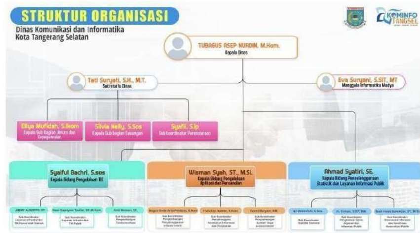
Gambar 2.2 Struktur Organisasi Dinas Komunikasi dan Informatika