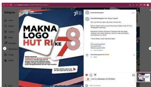
Gambar 3.1 Konten Praktikkan Buat Caption

Total praktikkan membuat caption selama melakukan Kerja Profesi di Dinas Komunikasi dan Informatika yaitu sebanyak 39 caption dan 39 feeds instagram yang praktikkan buat untuk caption. Dari 39 caption ini praktikkan mendapatkan insight yang cukup tinggi dan juga menarik audience untuk melihat dan mencari tahu terkait konten tersebut.