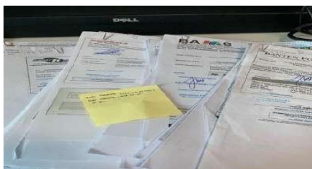
Gambar 3.5 Dokumentasi Surat Publikasi Media Cetak

Kegiatan publikasi monitoring adalah adalah kegiatan merekap data publikasi yang sudah selesai dikerjakan dan disusun sesuai dengan tanggal dan format yang sudah tersedia, Humas melaporkan kegiatan pimpinan daerah dan membagikannya melalui media sosial atau situs web resmi, sehingga masyarakat dapat mengikuti aktivitas Wali Kota, Wakil Wali Kota, dan agenda kota lainnya.