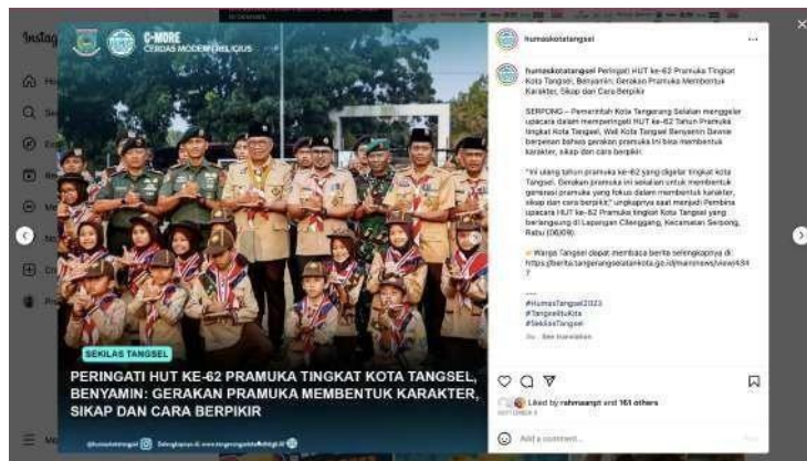
Gambar 3.4 Caption Instagram

dalam bentuk grid dan juga dijadikan beberapa slide untuk ditayangkan didalam feeds Instagram @humastangsel. Praktikan akan selalu menggunakan smartphone untuk mengambil foto tersebut. Dengan menggunakan resolusi yang tersedia di smartphone tersebut. Dengan menggunakan resolusi 30 HD landscape. Praktikan juga akan selalu mengikuti semua kegiatan pimpinan dengan memegang posisi sebagai fotografer kegiatan pimpinan tersebut.