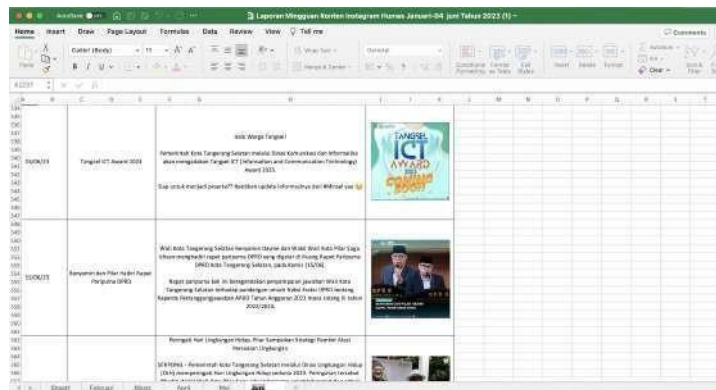
Gambar 3.2 Recap Konten

Seperti dilampirkan diatas, recap konten yang akan dilakukan secara digital menggunakan Microsoft excel dan akan dilakukan secara bergantian dan secara bertahap. Analisis engagement ini memengaruhi untuk menganalisis audience dalam setiap konten di Instagram @humastangsel.