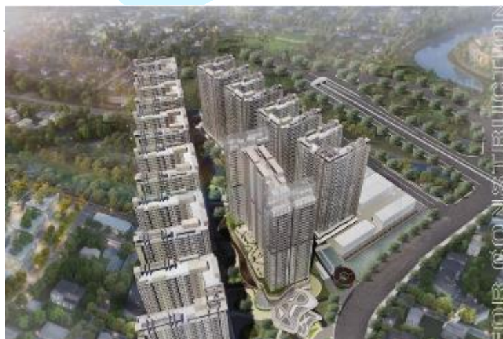
Gambar 1.1 Bentuk 3D Tokyo Riverside Apartment

Suksesnya pengembangan daerah PIK 1 menjadi latar belakang bagi pengembang Agung Sedayu Grup untuk mengembangkan PIK 2. Ketidaktersediaan lahan dan tingginya harga tanah di Jakarta menjadi magnet tersendiri dan tantangan bagi pengembang properti (Agung Sedayu Grup dan Salim Grup) untuk mengembangkan sebuah mega project terbaru dan terlengkap di atas lahan reklamasi seluas 1000 hektar yang dinamakan "PIK 2 Sedayu Indo City".