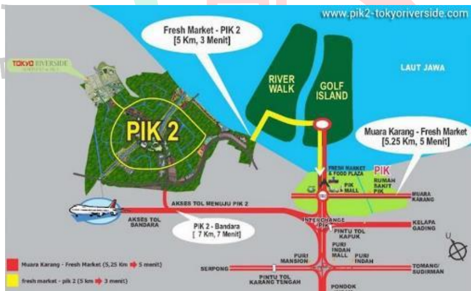
Gambar 1.3 Akses Jalan Menuju Tokyo Riverside Apartment