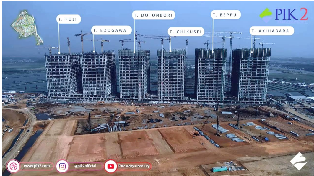
Gambar 1.6 Foto Aktual Pembangunan Tokyo Riverside Apartment