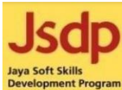
Gambar 2. 3 Logo Jaya Softskills Development Program (JSDP)

Pada tahun 2011 awalnya Universitas Pembangunan Jaya hanya berfokus pada pendidikan akademik seperti Liberal Arts , Sustainable Eco Development , dan Entrepreneurship atau yang disebut dengan kurikulum Pola Ilmiah Pokok (PIP). Kemudian Universitas Pembangunan Jaya mengembangkan pemikiran terhadap pentingnya pembentukan karakter untuk mahasiswa sehingga dibentuk kelompok kecil untuk mempersiapkan sebuah program pengembangan karakter yang bernama Jaya Student Development Program (JSDP) yang bergerak dibawah kepemimpinan pengurusan Unit Pengembangan Karakter. Kemudian seiring berjalannya waktu terdapat perkembangan dan perubahan terhadap program pembentukan karakter ini yaitu di rubahnya tujuan dari pengembangan softskills untuk mahasiswa menjadi untuk seluruh civitas akademika Universitas Pembangunan Jaya yang sekarang dikenal dengan unit JSDP. Soft skills yang akan dikembangkan oleh unit JSDP sesuai dengan Nilai-nilai Jaya, yaitu Integritas, Keadilan, Komitmen, Disiplin, dan Motivasi (LPMU, 2016).