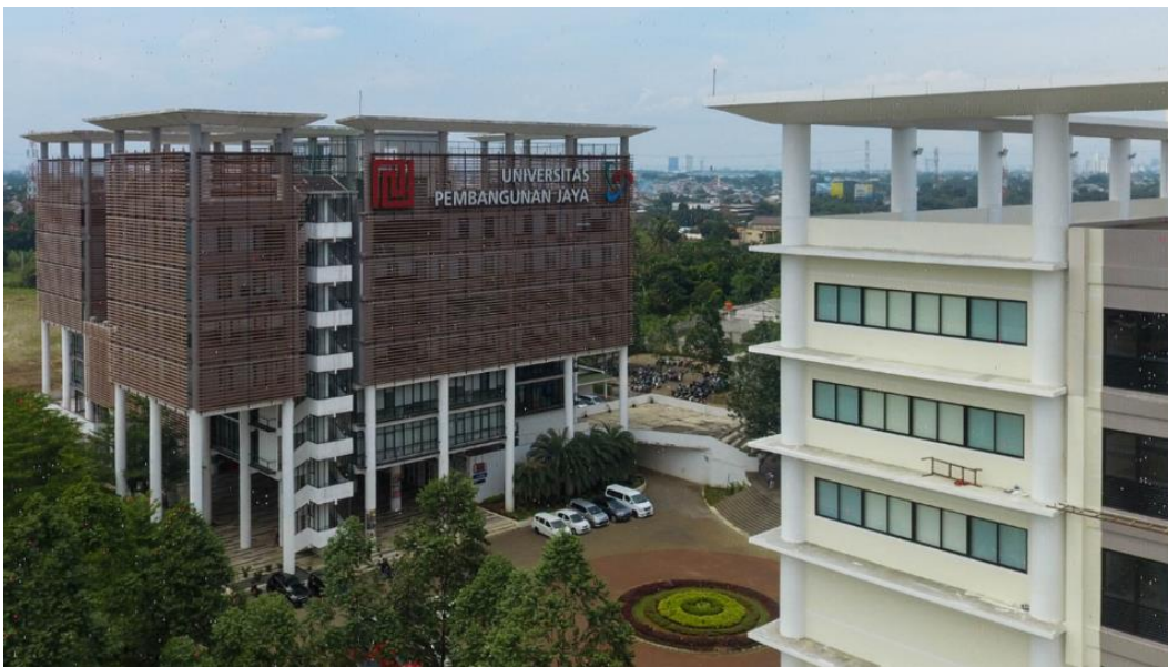
Gambar 2. 1 Gedung Universitas Pembangunan Jaya Hastuti, M (2021)

Universitas Pembangunan Jaya sudah berdiri pada tahun 2011 lebih tepatnya pada tanggal 25 Februari 2011 yang didirikan oleh kelompok usaha Pembangunan Jaya dengan mendapat izin operasional sesuai dengan surat keputusan menteri nomor 38/D/O/2011. Kelompok bidang usaha Pembangunan Jaya menjadi peran penting dalam terbentuknya Universitas ini dengan memiliki pengalaman lebih dari 50 tahun dalam mengelola sektor usaha dan beritikad untuk mengabdikan sebagian dari kegiatan usaha induknya ke pendidikan dalam membangun sumber daya manusia Indonesia yang lebih berkualitas dimana telah diwujudkan sejak 3 September 1991. Kelompok usaha Pembangunan Jaya sendiri memiliki 17 usaha yang bergerak di bidang manufaktur, properti, konsultan manajemen, konsultan manajemen, konsultan desain, pariwisata/ rekreasi, kontraktor, trading, mekanikal dan pendidikan. Berkat kerja keras dari semua keluarga Universitas Pembangunan Jaya untuk mengembangkan dan menjadikan rumah pendidikan yang lebih baik bagi mahasiswa, pada tahun 2011 Universitas Pembangunan Jaya